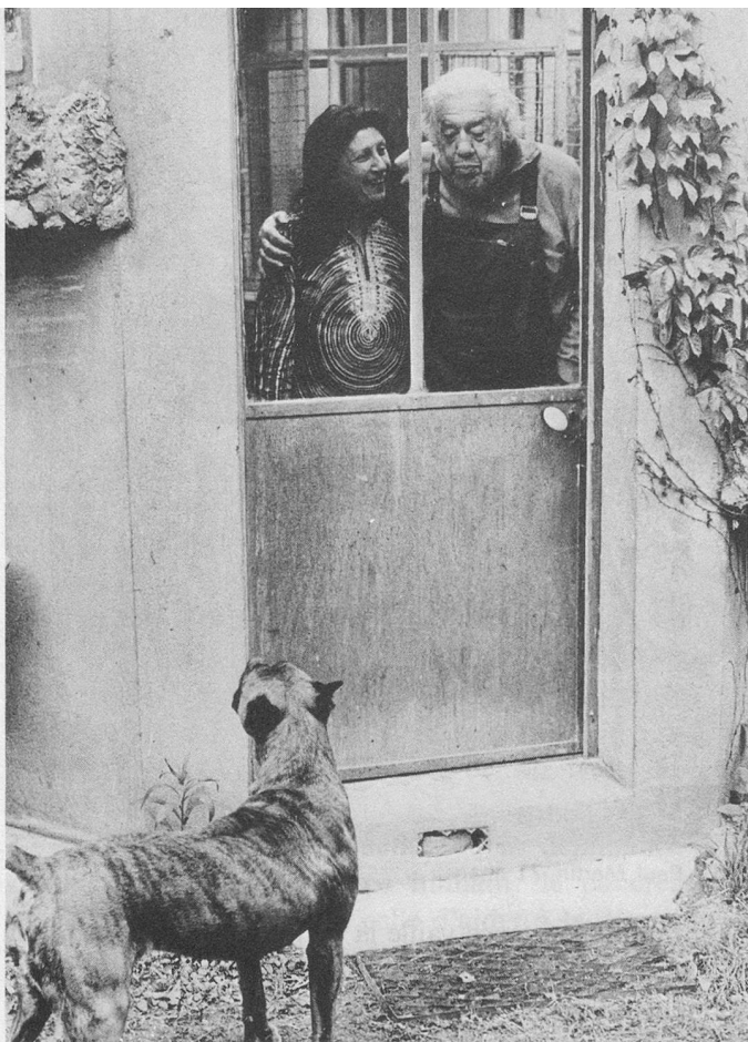
Linda le boxer voudrait jouer.