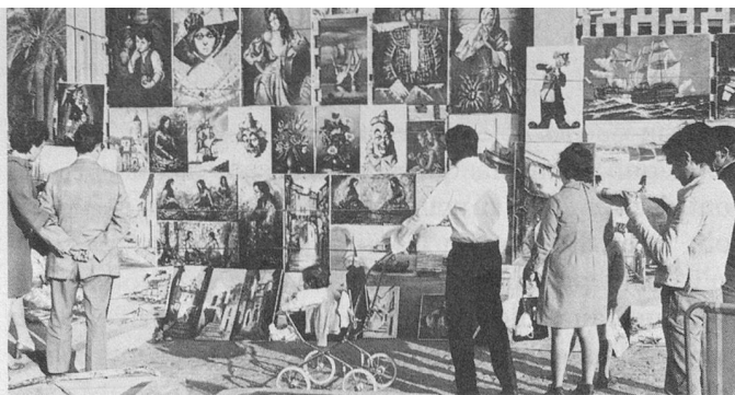
Tout près du port de Palma, une exposition en plein air parmi d'autres.

A Palma de Majorque, deux hôtels modernes et confortables reçoivent nos voyageurs: l'Hôtel Bahamas, à Portals Nous, et l'Hôtel Torrente à El Arenal. Tous