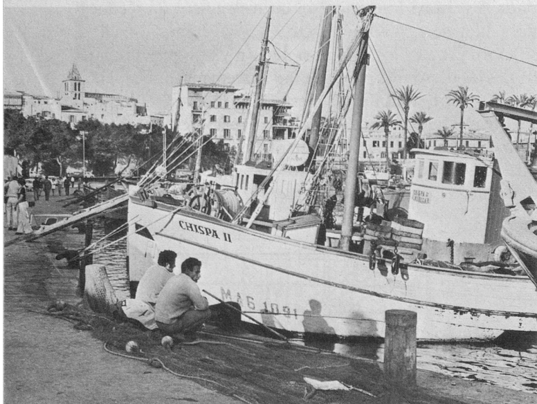
Flâner sur les quais de Palma, sous le ciel bleu, parmi les pêcheurs.

Nos voyages de vacances à Palma de Majorque (Espagne), Dubrovnik (Yougoslavie) et Beyrouth (Liban) sont pour nos abonnés et amis une occasion rêvée de raccourcir l'hiver, cette saison froide que tant de personnes redoutent, surtout à un certain âge. Les jeunes attendent l'hiver avec impatience, pour pouvoir se livrer aux joies du ski. Mais pour beaucoup de plus de 60 ans, la saison blanche constitue une véritable épreuve. Il y a le froid, l'humidité, les chemins glissants et la grippe qui menace.