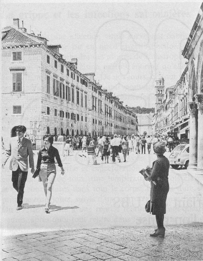
La vieille ville de Dubrovnik est une merveille. On n'y circule qu'à pied.

DUBROVNIK (Yougoslavie): Départs les 2 février 1973, 16 février, 2 mars, 16 mars . Quinze jours de vacances, tout compris, avion-jet et hôtel très grand confort (2 piscines) pour Fr. 485.— (abonné); Fr. 495.— avec abonnement d'un an; Fr. 525.— pour personne non abonnée (chambre 1 lit, supplément Fr. 70.—).