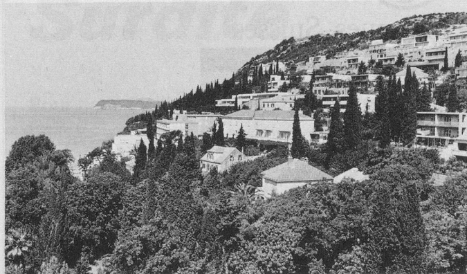
Vue du balcon d'une chambre de l'Hôtel Park, à Dubrovnik.

Je m'inscris / Nous nous inscrivons pour le voyage-vacances à