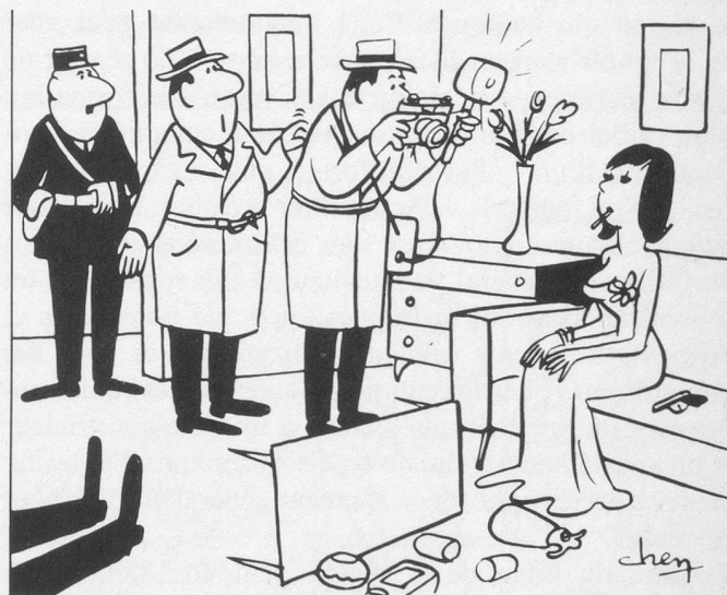
C'est ce corps-là qu'il faut photographier ! (Dessin de Chen - Cosmopress)