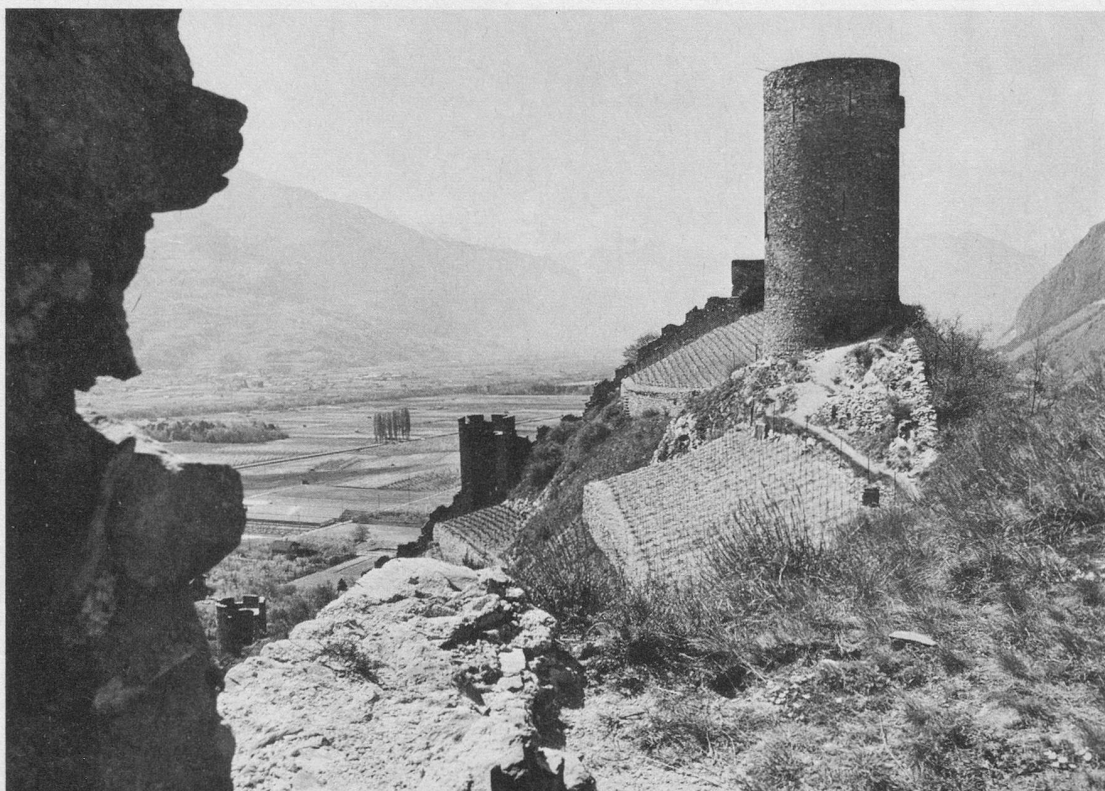
Saillon : un morceau de Moyen Age au cœur du Valais.