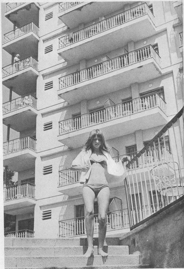
Un hôtel moderne où la jeunesse n'est pas absente.