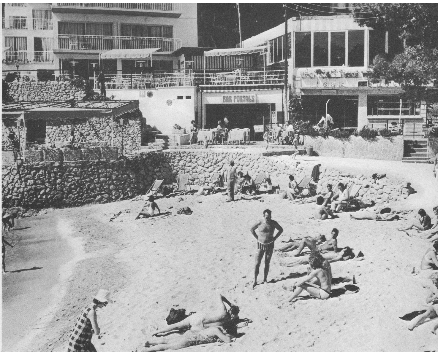
La plage est située à deux cents mètres de l'hôtel. On y trouve aussi d'accueillantes guinguettes où la sangria est fraîche.