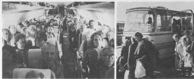
Les moyens de transport les plus modernes à la disposition des retraités: jet et car.