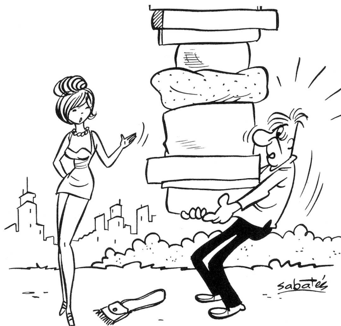
Tu étais plus galant il y a quelques années: tu aurais ramassé mon sac... (Dessin de Sabatès)

15, rue Haldimand Lausanne Téléphone 20 20 51 2, place du Marché Vevey Téléphone 51 39 39 11, place Pestalozzi Yverdon Téléphone 2 54 78