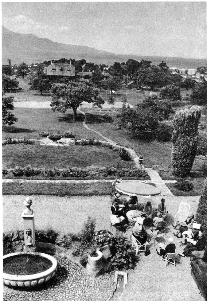
Un vaste parc, un merveilleux panorama. Vue prise d'une fenêtre de la « Nouvelle Roseraie ».