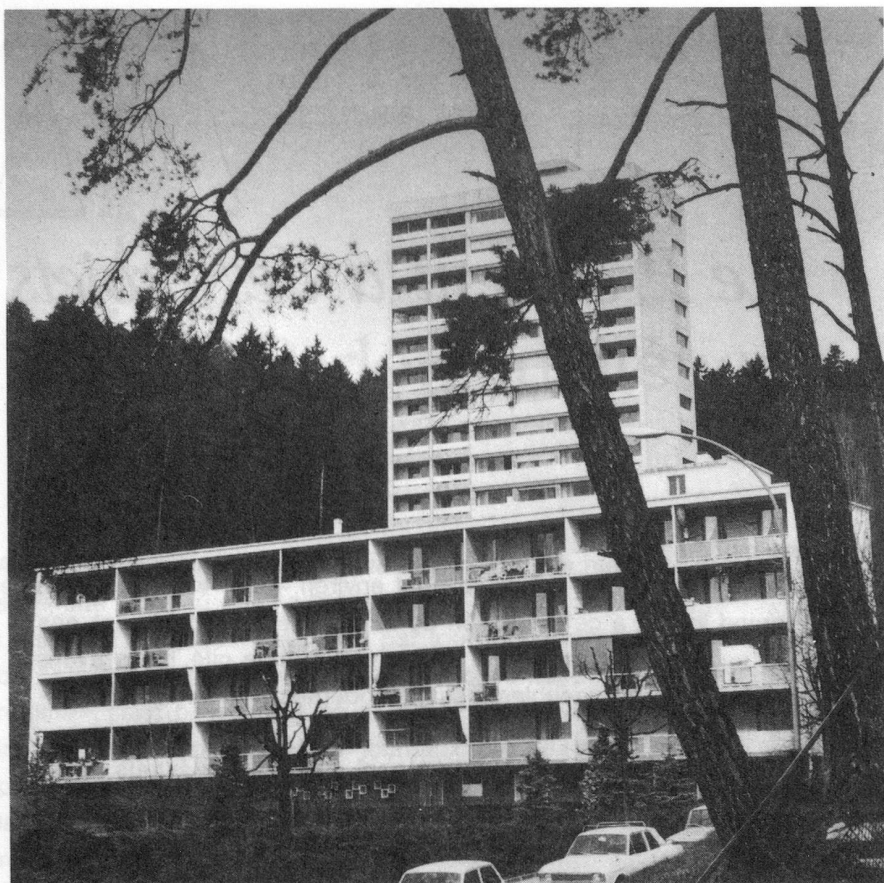
« Cadolles 13 » existe depuis 14 ans.

« Verger Rond ». Comme à « Cadolles 13 », la liste d'attente est longue, d'où la nécessité de construire un 3e immeuble.