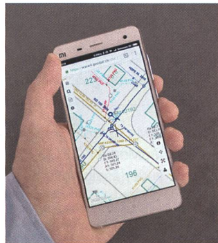
Abb. 2: Basismodul optimiert für Smartphones.

Das erste Halbjahr 2016 stand für WebGIS Thurgau im Zeichen des Updates ihrer WebGIS Plattform auf die neuen Versionen von GeoMedia WebMap und Basismodul. Damit verbunden wurden diverse Optimierungen in Bezug auf Performance und Funktionserweiterungen, wie z.B. die Inte-