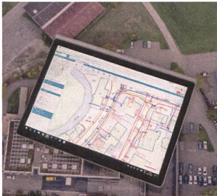
Abb. 1: Werkleitungsdaten im neuen WebGIS.

WebGIS-Thurgau ist eine einfache Gesellschaft mehrerer Ingenieur-Büros in der Ostschweiz, welche ihren Kunden – mehrheitlich Gemeindeverwaltungen und Werksbetreiber – umfassende WebGIS-Dienstleistungen anbietet. Eine Übersicht über das Leistungsspektrum von WebGIS Thurgau findet sich unter http://wgis.ch .