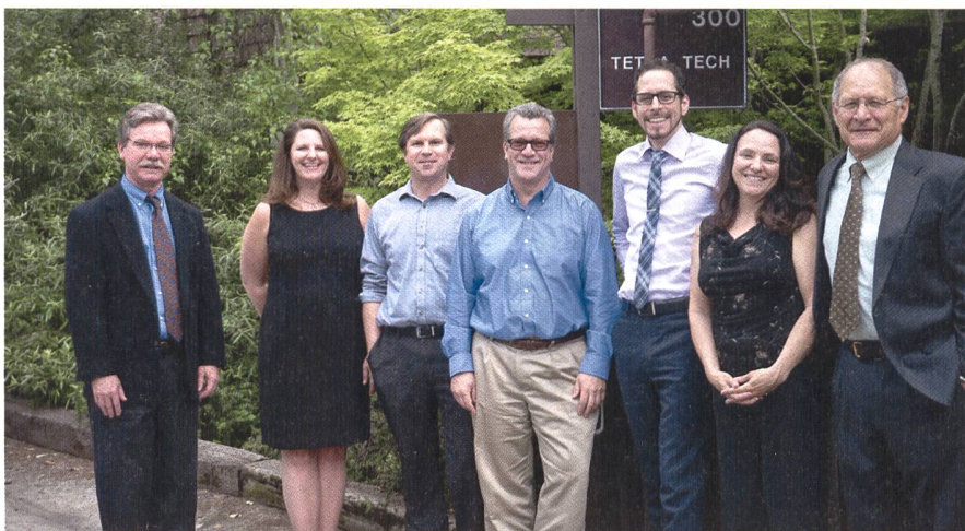
Le groupe géomatique de Tetra Tech à Lafayette, lors de la réception des représentants du NOAA (National Oceanic and Atmospheric Administration).

En décembre 2014, j'ai accepté un poste de responsable des traitements LIDAR auprès du département de géomatique de Tetra Tech. Cette multinationale, est un chef de file mondial dans la consultation et les services d'ingénierie pour le génie civil et environnemental. Une de mes principales tâches a consisté à établir une chaîne de traitement des données LiDAR optimisée, afin de garantir le respect des délais et des standards de qualité requis par les clients. Pour ce faire, j'ai donc dû rapidement me familiariser avec les différentes normes publiées par l'USGS (U.S. Geological Survey) et l'ASPRS (American Society of Photogrammetry and Remote Sensing), ainsi qu'avec les dimensions parfois gigantesques des projets. L'apprentissage de nouveaux logiciels m'a permis de produire des données LiDAR dans le format LAS 1.4, qui tend à devenir la norme aux Etats-Unis et qui le devient.