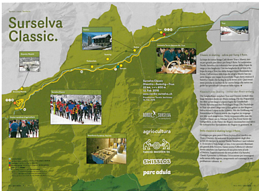
Abb. 2: Als Partner von Surselva Classic hat der Parkkandidat Parc Adula eine Karte zum Anlass erstellt: Der Park bringt sich mit dem Parkperimeter, mit der Verpflegung von lokalen Spezialitäten sowie dem öffentlichen Verkehr ein.

Mehrwert gegenüber den «Nichtparkgebieten» entsteht. Im Wildnispark Zürich Sihlwald sind es die Ranger, welche Beobachtungen wie z.B.