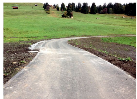
Abb. 4: Weg nach der Erneuerung.