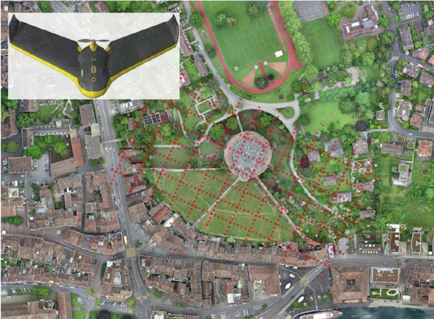
Abb. 2: eBee-Microdrohne (oben links) und True-Orthophotomosaik des beflogen Gebiets (inkl. skizzierte Fluglinien).