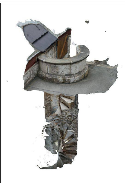
Abb. 3: 3D-Dreiecksvermaschungen der Wendeltreppe.

Bei der Generierung möglichst dichter, texturierter Punktwolken für die Weiterverarbeitung im eingangs vorgestellten Workflow spielen die Hardwareressourcen und Prozessierungszeiten eine wichtige Rolle. Mit der verfügbaren Hardware 1 und im zeitlichen Rahmen des Blockkurses wurden gesamthaft 470 Nadir- und 50 Obliqueaufnahmen in einem einzigen Block prozessiert. Bei der experimentel-