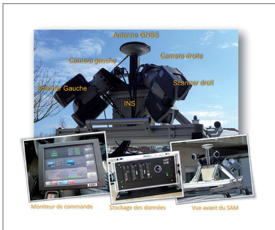
Fig. 1: Présentation du SAM.

Le choix de l'emplacement des points de base a été effectué avec deux conditions principales. La première est d'optimiser au mieux l'emplacement des points en vue des futures stations totales. Le but est d'avoir le meilleur recouvrement possible pour le calcul des stations libres. La seconde condition est d'avoir un masque GNSS dégagé pour la mesure des points en statique.