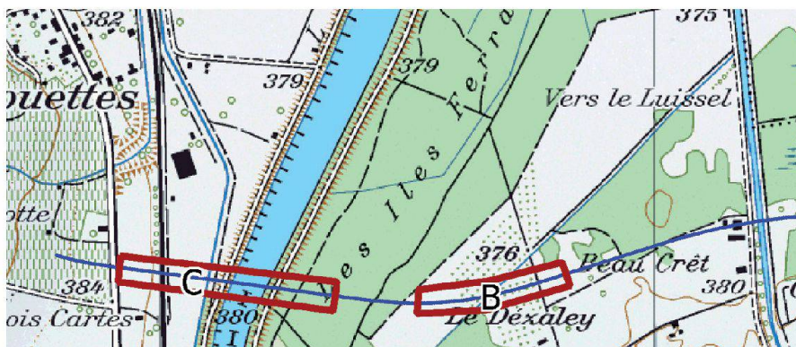
Fig. 3: Zone du segment géométrique.

Le raster de comparaison finale, nous montre des écarts allant de -5 à -6 [mm] sur le secteur Ouest du pont et de +1 à +4 [mm] sur le secteur Est, ce qui nous donne une différence entre les deux scans de l'ordre du centimètre. On distingue aussi des halos tout autour des stations au niveau des scans statiques. Ces halos peuvent s'expliquer par la densité de points relevés, un des inconvénients des