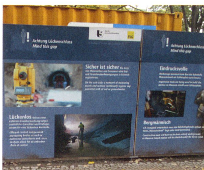
Abb. 6: Publikumsinformation an der U-Bahnbaustelle über die Bedeutung der Vermessung beim Untertagebau.

Das Landmanagement war sowohl im Fachprogramm als auch in der Ausstellung prominent vertreten. Als Folge der breiteren Verfügbarkeit und Nutzung der Geodaten und den daraus gewonnenen Geoinformationen