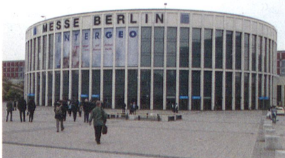
Abb. 1: Das grosszügige Messegelände im Westen von Berlin.

Für eine weitere Aussprache der Präsidenten und einzelnen Begleitern der Berufsverbände aus Belgien, Deutschland, Österreich, Luxemburg, den Niederlanden und der Schweiz betreffend Fragen zur Nachwuchsförderung, Ausbildung und Berufsbezeichnung stellte der DVW das Medienzentrum zur Verfügung. Rudolf Küntzel besorgte die Einladung in Absprache mit dem Präsidenten des DVW und schlug vor, dass eine gemeinsame vorbereitete Resolution zu Händen der Politik gefasst werden könnte. In einer ersten Runde informierten die Anwesenden über die Entwicklungen und Erfahrungen in ihren Ländern wie folgt: In Deutschland hat sich die 2011 aufgrund einer Grundsatzstudie vorgeschlagene, durch