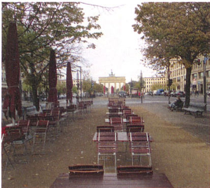
Abb. 4: Blick aus der Prachtsstrasse «Unter den Linden» über den Pariser Platz Richtung Westen zum Brandenburgertor.

und Weise vorgestellt. Auch die Niederlande haben eine entsprechende Homepage ( www.arbeitsmarktgeo.nl ) eingerichtet. Der Erfolg dieser Massnahmen ist unübersehbar.