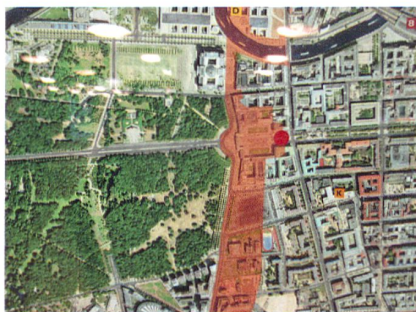
Abb. 5: Information am Pariser Platz zur Zeitgeschichte mittels Orthophoto über den Verlauf der Berliner Mauer und der Sperrzone (Errichtung 13. August 1961 bis Mauerende 9. November 1989).

gestellt werden konnte. Immer deutlicher ist festzustellen, dass praktisch in allen Kernthemen Sinn und Zweck der Datenerhebung und des Datenmanagements für Landentwicklung, Landmanagement und selbstverständlich der Eigentumssicherung zu dienen haben.