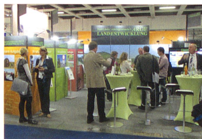
Abb. 3: Der attraktiv gestaltete Stand der ARGE Landentwicklung mit Informationstafeln, Bildschirm für Kurzvorträge.

Die Niederlande haben, allerdings unter dem Titel Geoinformation, ein durchgreifendes Förderprogramm im Rahmen einer Foundation entwickelt, das bereits mit der Primarschulstufe beginnt. Dieses Netzwerk wurde den Teilnehmern der geosuisse -Studienreise im September 2014 auf überzeugende Art