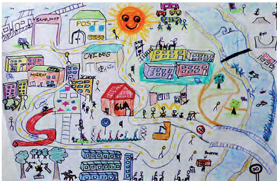
Abb. 2: Kognitive Karte eines Quartiers nach sozialen Kriterien und Vorstellungen von Studierenden der Sozialen Arbeit.

pe wichtige Planungsvorhaben bereits vor der Realisierung und angereichert durch Stadtteilbegehungen, Mental Maps/kognitive Karten (s. Abb. 2 und 3) und anderen sozialräumlichen Methoden zu weiteren, primär nicht ersichtlichen, aber planungsrelevanten Informationen führen können. Die forschungsleitenden und sich methodisch an Sozialwissenschaft und Geomatik gerichteten Fragen lauten hierbei: Wie lassen sich Raumvorstellungen und Entwicklungsszenarien unter räumlichen und sozialen Kriterien methodologisch erfassen? Wie lassen sich Bilder der Zukunft darstellen? Welche partizipativen Eigenschaften in der Kombination aus sozialer Bedeutung und technischer Umsetzung müssen Instrumente besitzen, um in einem Planungsprozess zur Anwendung zu kommen? Wie kann ein transdisziplinärer und multiperspektivischer Dialog unterstützt werden?