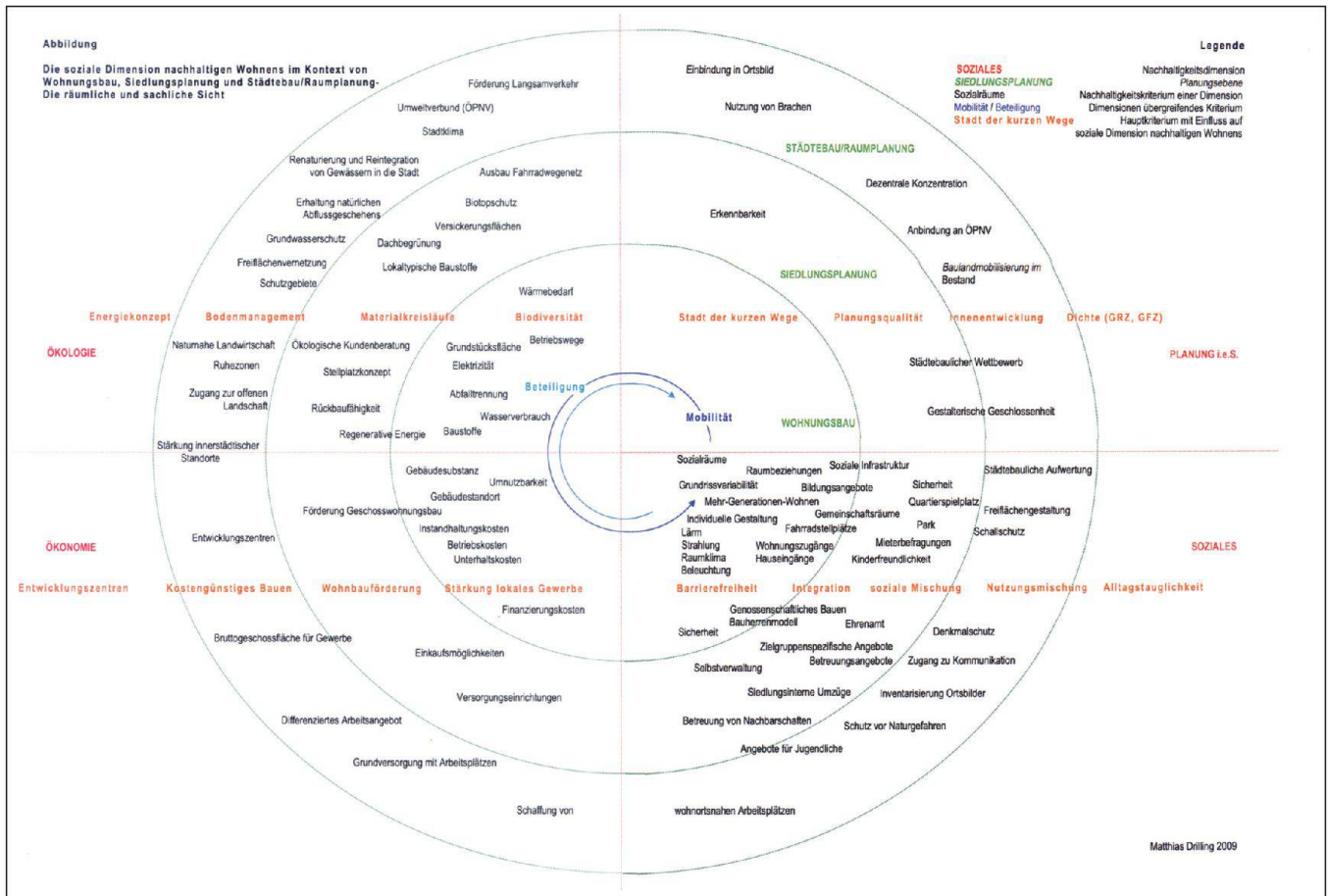
Abb. 1: Themenspektrum sozialräumlicher Untersuchungsebenen am Beispiel der sozialen Dimension nachhaltigen Wohnens im Kontext von Wohnungsbau, Siedlungsplanung und Städtebau/Raumplanung; vgl. Drilling, Matthias (2009): Die soziale Dimension nachhaltigen Wohnens. Überlegungen zu Bewertungssystemen für die Siedlungsplanung. Mit einem Fallbeispiel Freiburg-Rieselfeld. Abschlussarbeit MAS Raumplanung. Zürich: ETH; 60–61.

«Stadtentwicklung auf Augenhöhe» mit Kunst- und Pädagogikstudierenden der FHNW, während einer Blockseminarwoche zur Stadtentwicklung mit Exkursionen für Studierende der Sozialen Arbeit sowie während eines halbtägigen Workshops mit Studierenden der Geoinformatik, der Sozialen Arbeit und zukünftigen Nutzenden auf dem Dreispitz-Areal in Basel. 5 In allen Fällen wurden die Probanden aufgefordert, ein bestimmtes Areal bzw. einen Stadtteil anhand von sozialräumlichen Aufgabenstellungen zu erkunden. Beispielsweise ging es beim Workshop zur «Stadtentwicklung auf Augenhöhe» darum, sich bewusst in die Rolle von alten Menschen zu begeben oder mit einem Kinderwagen den Stadtteil zu durchlaufen und Hindernisse anhand schriftlicher Notizen und Fotos festzuhalten. Durch die