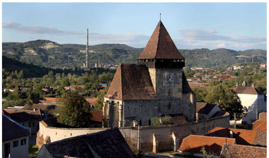
Abb. 1: Ansicht der Kirchenburg in Frauendorf.