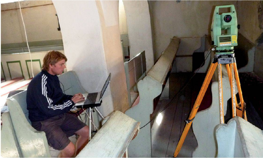
Abb. 2: Schweizer Studierender bei der Arbeit.

zer Vermessungsstudierenden sowie zwei Bauingenieur-Studentinnen zusammen. Die erhobenen Daten werden als Dokumentation der Kirchenburg, beispielsweise als virtuelles Museum, verwendet. Zudem ist die Restaurierung und Wiederinstandstellung der Kirchenburg geplant, wobei die Daten als Planungsgrundlage dienen sollen. Von den Bauingenieur-Studentinnen wurden Schäden dokumentiert, Baustoffe analysiert und nach statischen Lösungen gesucht. Die Auswertungen (3D-Modell, Grundriss- und Schnittpläne) werden nach Abschluss dem evangelischen Landeskonsistorium zugestellt, welches auch als Auftraggeber auftritt. Unterstützt wurde das Projekt von Privatpersonen, Stiftungen und den beiden Hochschulen (HTW und FHNW). Auch die Projektteilnehmenden hatten einen finanziellen Eigenanteil zu leisten.