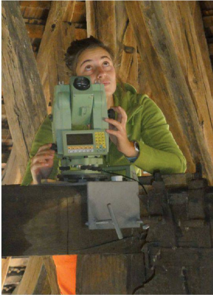
Abb. 4: Bei der Arbeit mit der Balkenklemme.

wonnen werden. Täglich wurde man mit neuen Herausforderungen konfrontiert, so zum Beispiel instabilen Böden, Holzbalken in luftiger Höhe, Sichtbehinderungen oder beengenden Platzverhältnissen. So waren auf dem Turm und Dachstuhl einige Kletterpartien nötig oder es mussten einige Dachziegel entfernt werden um wieder freie Sicht zu den Festpunkten zu erhalten. Mit Balkenklemmen wurde das Tachymeter teilweise direkt an Holzbalken befestigt, so entstanden auch unkonventionelle Stationierungen (Abb. 4). Die Personen und das Instrumentarium wurden jedoch wenn nötig stets gesichert.