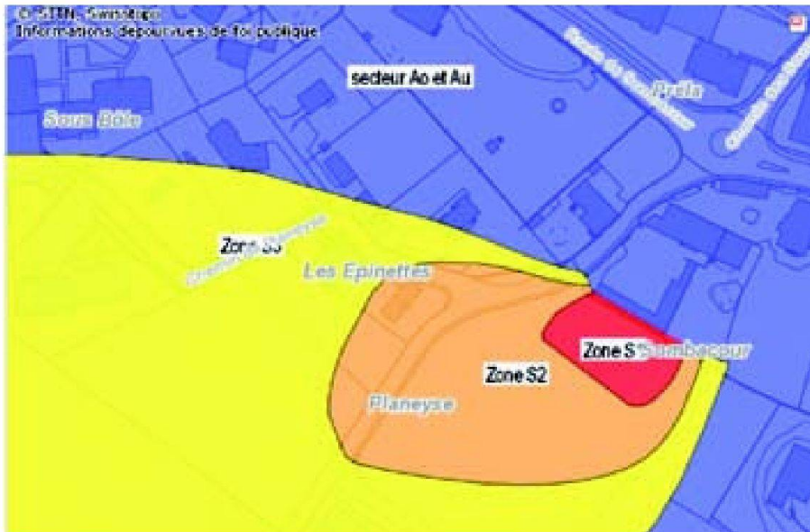
Abb. 2: Die ÖREB können vom Referenzplan unabhängig sein.

Spezialisten, der die Numerisierung des Plans vornimmt. Die Frage, «Was geschieht, wenn eine der beiden aufeinander bezogenen Informationsebenen sich ändert?» muss der Entscheidungsträger beantworten. Die Frage ist umso heikler, als der Parzellenplan privatrechtlichen Kriterien und der Nutzungsplan öffentlich-rechtlichen Kriterien unterliegt.