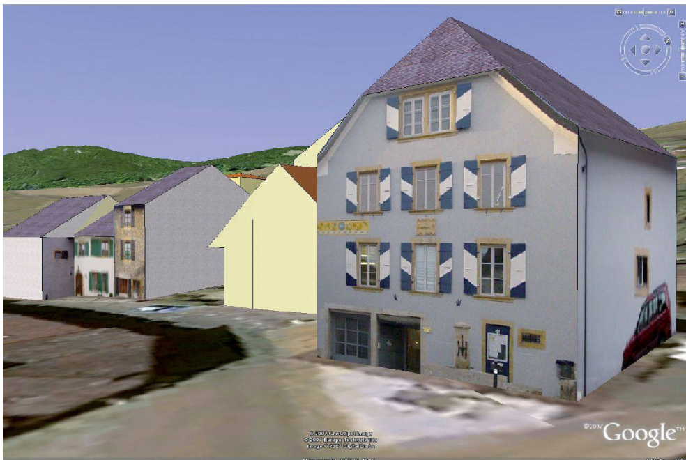
Fig. 3: Bâtiments 3D simplifiés avec la photo des façades.

dispensable de couper les bâtiments de la MO en utilisant la couche ODEL. Il n'est pas forcément évident d'automatiser cette opération.