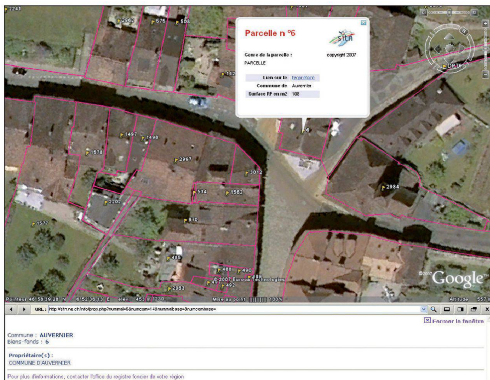
Fig. 4: Parcelle avec lien sur le propriétaire.