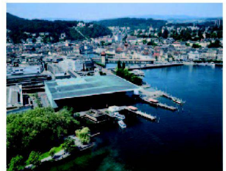
Luzern mit KKL.