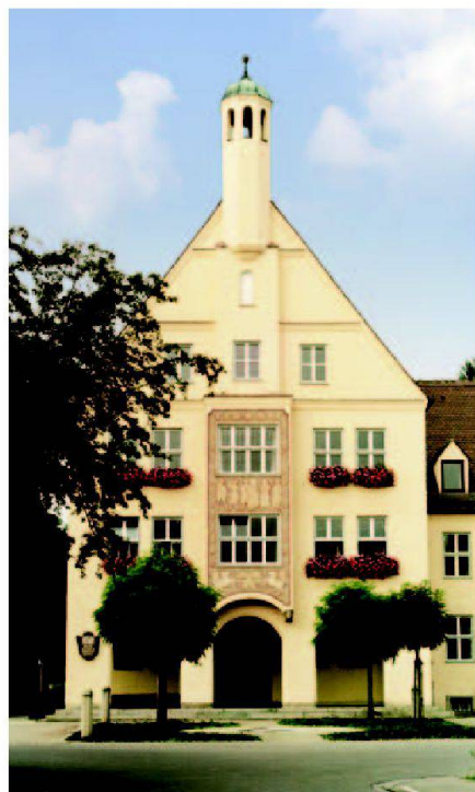
Abb. 2: Amt für Ländliche Entwicklung Schwaben.

In rund 1900 Verfahren der Ländlichen Entwicklung mit über 700 000 ha wird derzeit gemeinsam mit mehr als 1,2 Mio. Bürgern deren Lebensraum neu gestaltet