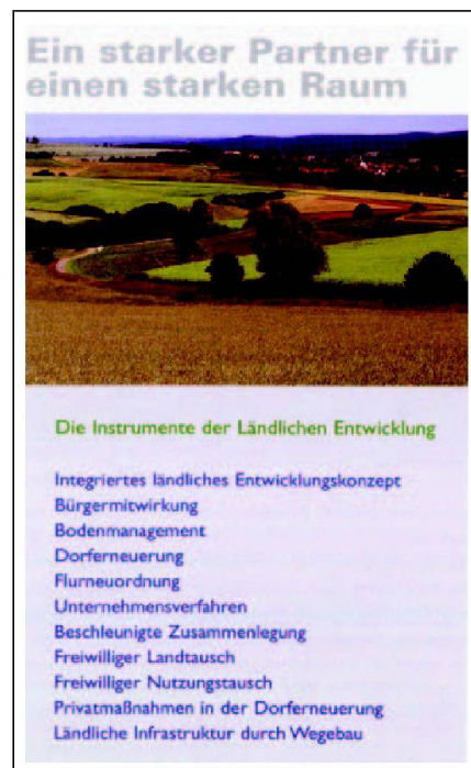
Abb. 3: Instrumente der Ländlichen Entwicklung.

Die Ländliche Entwicklung in Bayern ist als staatliche Verwaltung organisiert. Oberste Landesbehörde ist das Bayerische Staatsministerium für Landwirtschaft und Forsten, München. Dieses hat die Aufsicht