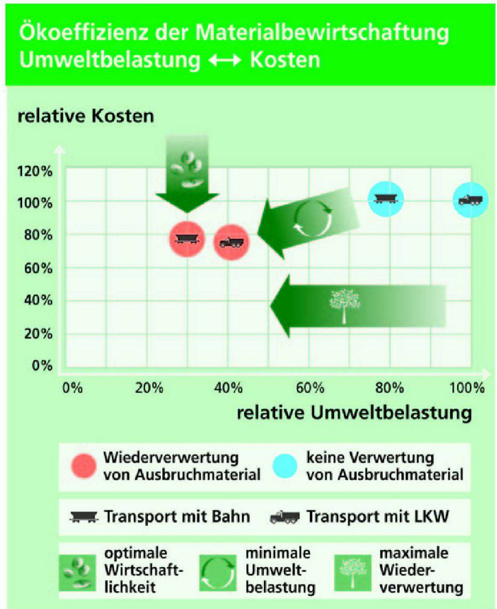
Abb. 4: Ökoeffizienz.

Hans-Christian Angele Ernst Basler + Partner AG Zollikerstrasse 65 CH-8702 Zollikon hans-christian.angele@ebp.ch