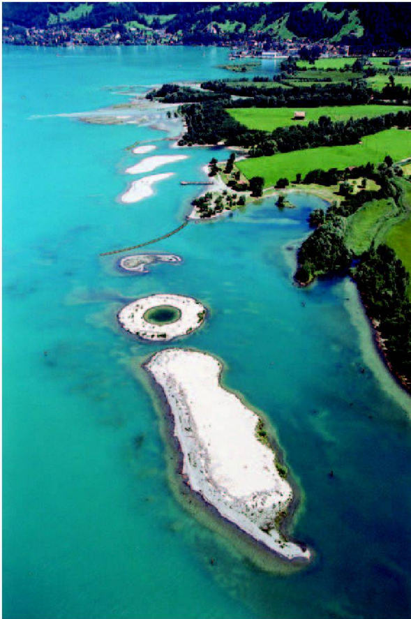
Abb. 3: Seeschüttung.

nen Lebensräume den ansteigenden Güterverkehr verkraften. Schon bei der Planung des Jahrhundertprojekts, aber auch während der Bauzeit und schliesslich wenn später die Hochgeschwindigkeitszüge im langen Basistunnel fahren, immer stellt sich die Frage: Wie wirkt der Bau des Gotthardtunnels auf Luft und Wasser, Mensch und Tier?