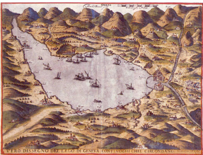
Fig. 1: Luca Bertelli et Franco, Vero disegno del lago di geneva, eau-forte aquarellée, 1585–1589, Musée historique, Lausanne (Photo MHL/S. Pittet).

Musée historique de Lausanne Place de la Cathédrale 4 1005 Lausanne tél. 021 315 41 01, fax 021 315 41 02 musee.historique@lausanne.ch www.lausanne.ch/mhl