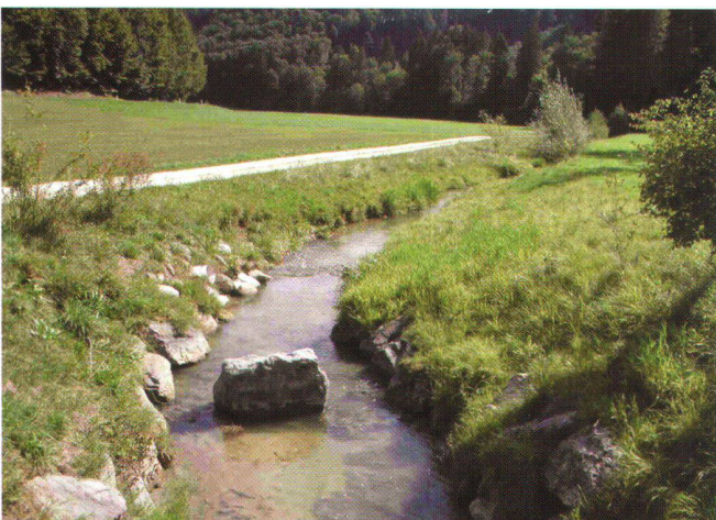
Abb. 1: Der «Chrouchtalbach» wurde beispielhaft renaturiert: Das Fließgewässer erhielt seinen Raumbedarf zurück.

Projekt für das ganze Gemeindegebiet zu erstellen, landwirtschaftliche Güter neu aufzuteilen und zusammenzulegen, alte Wege und Ställe zu sanieren oder neue zu erstellen. Im Rahmen der Gesamtmelioration wurde auch eine langjährige Idee der Neugestaltung des «Chrouchtalbachs» in die Tat umgesetzt. Seit Jahrzehnten suchten die Gemeinden Burgdorf, Oberburg, Krauchthal und Hasle nach einer geeigneten Lösung, um die durch den «Chrouchtal-», «Luter-» und «Biembach» verursachten Hochwasserprobleme in den Griff zu bekommen. Man wollte sowohl die Siedlungen als auch die landwirtschaftlichen Flächen schützen. Gemäss Peider Mohr von der Abteilung Strukturverbesserungen des Kantons Bern war es nicht immer einfach, die verschiedenen Interessen unter einen Hut zu bringen.