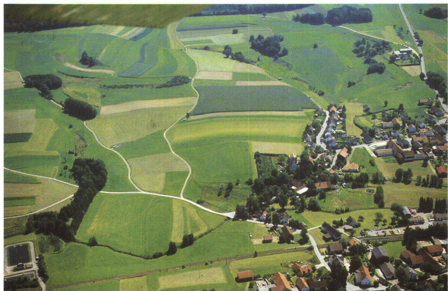
Abb. 3: Bodenordnungsinstrumente in der ländlichen Entwicklung helfen bei der Lösung von Landnutzungskonflikten und beim Flächensparen.

Für Thomas kommt wegen der Flächenansprüche aus Fachplanungen und der gemeindlichen Bauleitplanung einem nachhaltigen Landmanagement eine Schlüsselrolle zu. An Beispielen stellte er dar, wie