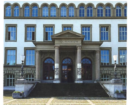
Abb. 1: Winterthurer Technikum, Hauptgebäude (2024).

vielsagenden Titel: «Ein Technikum für die Schweiz» mit einem eingeklammerten und doch interessanten Untertitel «(Ein Vorschlag aus Basel)» (in: e-newspaper-archives.ch). Dabei war der Autor, Friedrich Autenheimer (1821–1895), gebürtiger Aargauer von Stilli und leitete dannzumal