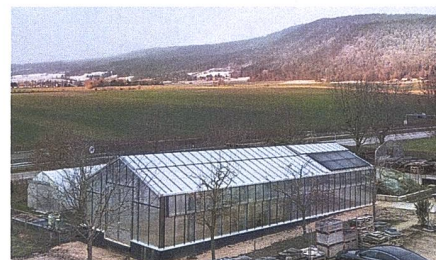
Nouvelle serre à plantons à Boudevilliers.

page à La Vue-de-Alpes, un séchoir à viande au Pâquier, le développement des activités de meunerie à Valangin, et une étable pour une production laitière avec élevage des veaux sous la mère à Cernier.