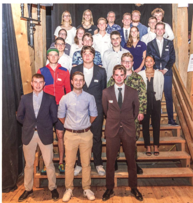
QV-Feier Kanton Bern.