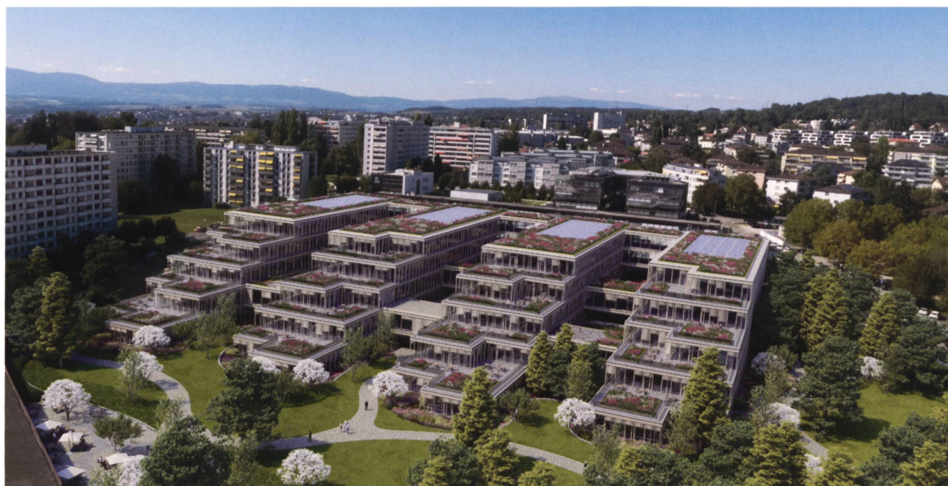
Unlimitrust Campus à Prilly.

Prochain module organisé (sous réserve de modification): «S4 Base de données» novembre 2023.