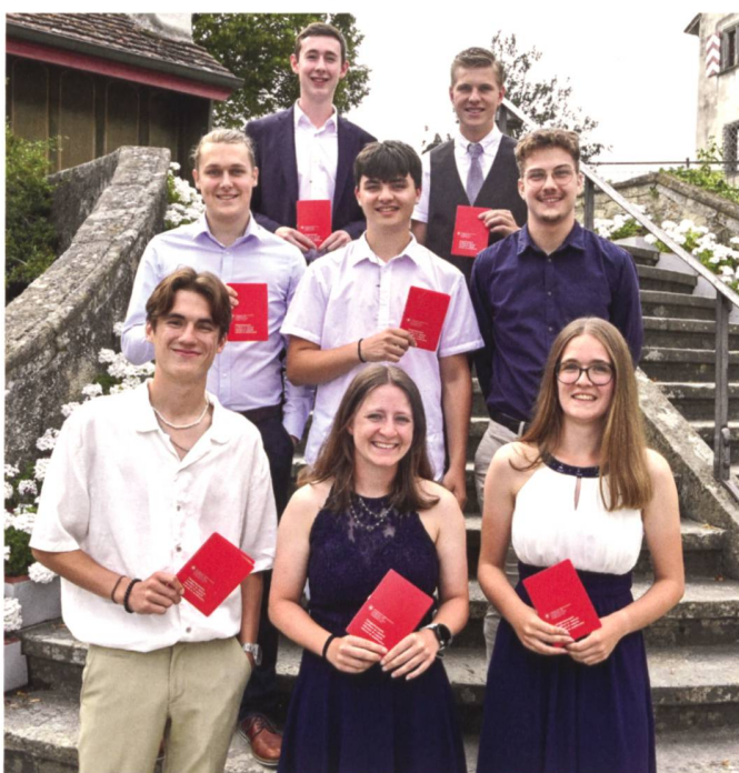
QV-Feier Kanton Aargau.