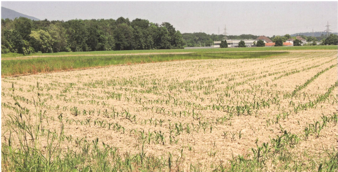
Abb. 1: Ansicht des Teilgebietes im Schachen in Deitingen/Flumenthal, welches für die Kompensation von FFF vorgesehen ist.

stimmte Vorhaben kantonale Nutzungspläne erlassen. Im Kanton Solothurn wurde dieses Instrument bei verschiedenen grossen Vorhaben wie Kraftwerksprojekte, Hochwasserschutz- und Gewässeraufwertungsprojekte, Ausgleichs- und Ersatzmassnahmen bei Strassenbauvorhaben, Deponien erfolgreich angewendet. Dabei muss der Kanton die Gemeinden anhören. Das heisst, die Gemeinden müssen damit einverstanden sein, dass ein Vorhaben mit einem kantonalen Nutzungsplan umgesetzt wird. Im vorliegenden Fall wurden die betroffenen Gemeinden Deitingen, Flumenthal, Härkingen und Neuendorf deshalb angehört und zur Mitwirkung eingeladen. Sie waren mit dem Vorgehen einverstanden und haben teilweise Stellungnahmen eingereicht. Für die Kompensation der FFF wurden in den Gemeinden Deitingen/Flumenthal, Neuendorf und Härkingen Standorte mit möglichen Flächen ausgeschieden und sind Bestandteil der Erschliessungs- und Gestaltungspläne. Diese bestehen aus einem Übersichtsplan im Massstab 1:25'000 sowie drei Teilplänen im Massstab 1:2000. Die Planinhalte beinhalten im Genehmigungsteil einen Geltungsbe-