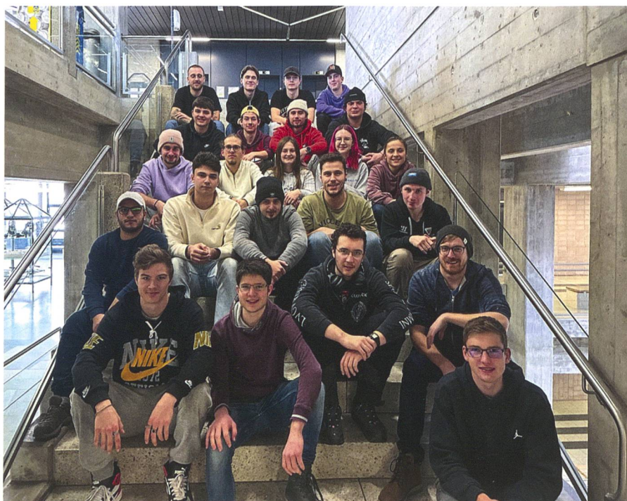
Abb. 3: Die Lernenden der Abschlussklasse GMA19c der BBZ.

Die GeomatikerInnen nahm schon früh eine Vorreiterrolle bei (teil-)digitalisierten Unterrichtseinheiten ein. So wurde bereits 2010 mit der Einführung des neuen Bildungsplanes das BYOD (Bring your own Device) eingeführt. Dabei bringen Lernende ihr eigenes Notebook mit zum Unterricht und setzen dieses bei relevanten Unterrichtseinheiten ein. Die konsequen-