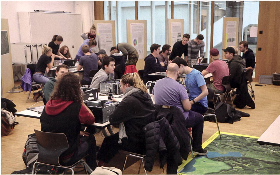
Abb. 4: Praxisorientiertes Lernen in einem der flexibel nutzbaren Labore des Instituts Geomatik im 10. Obergeschoss des Campus Muttenz.

Revision sollten die zukünftigen Bedürfnisse antizipiert und mit folgenden vier ausgewählten Vertiefungsprofilen möglichst gut abgedeckt werden: GeoDesign & Planung, GeoInformatik & Raumanalyse, GeoBIM & Infrastruktur sowie GeoSensorik und Monitoring. Der Beitrag «Redesign des Bachelorstudiengangs Geomatik FHNW» in dieser Ausgabe beschreibt die Zielsetzung und konkrete Ausgestaltung des revidierten Bachelorstudiengangs in Geomatik 2022 im Detail.