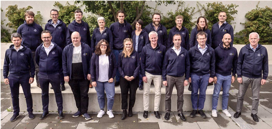
Abb. 6: Anwesende Teammitglieder des Instituts Geomatik im IGEO-Hoodie (Herbst 2022).

schliessung neuer Themenbereiche konnten wir nicht nur bestehende Professuren neu besetzen, sondern auch zwei neue Professuren schaffen. Zur weiteren Stärkung der Informatikausbildung wurde die bestehende Dozentur in Informatik in eine Professur für Geoinformatik und Computergrafik umgewandelt. Mit der Schaf-