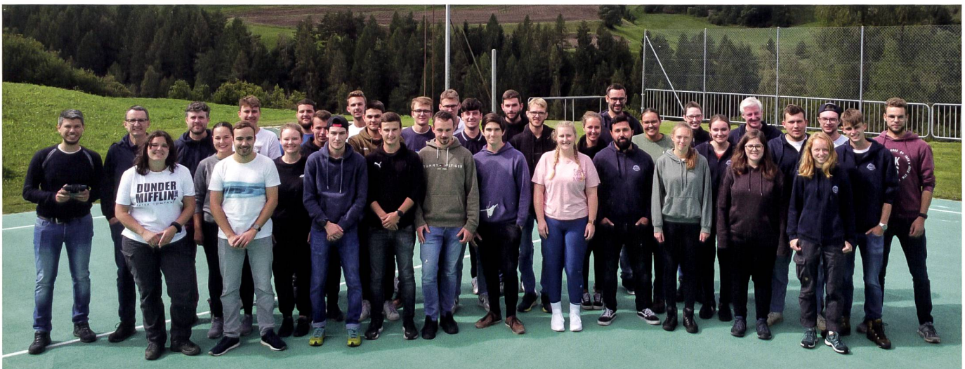
Abb. 7: Feldkurs 2022 in Surses (GR) mit dem erfreulich grossen Studienjahrgang G2021.

Das 60-jährige Jubiläum ist auch ein guter Zeitpunkt, um uns im Namen des Instituts Geomatik zu bedanken: bei den Studierenden und Mitarbeitenden der ersten Stunde, die mit ihrem grossen Engage-