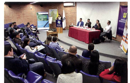
Abb. 5: Eröffnung des CAS in Landmanagement FHNW am IGAC in Bogotá, Kolumbien.

Über diese nationalen Weiterbildungsangebote hinaus wurde mit Unterstützung des Staatssekretariats für Wirtschaft (SECO) und in Zusammenarbeit mit der Universidad Distrital und der Universidad Sergio Arboleda in Bogotá sowie dem geographischen Institut Kolumbiens (IGAC) ein CAS in Landadministration entwickelt und im Jahr 2020 erfolgreich durchgeführt. Diese Kooperation mit kolumbianischen Partnerhochschulen zur Förderung der Kontinuität und des Modernisierungsprozesses in der Landadministration in Kolumbien soll in Zukunft weitergeführt werden.