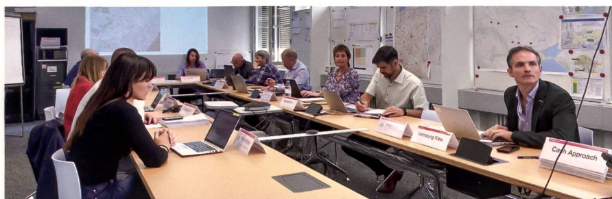
Fig. 3: Les cartes produites par les spécialistes en SIG sont toujours utilisées au sein des cellules de crise de l'Aide humanitaire à Berne.

Mary Brown Ozgür Unal Département fédéral des affaires étrangères DFAE Direction du développement et de la coopération DDC Aide humanitaire Effingerstrasse 27 CH-3003 Bern mary.brown@eda.admin.ch ozguer.unal@eda.admin.ch