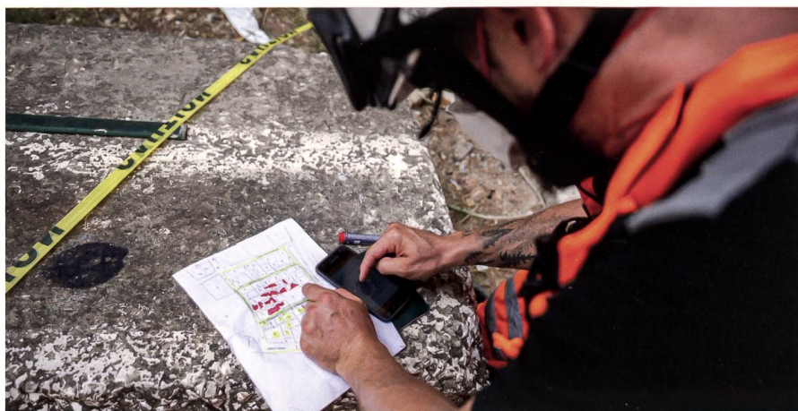
Fig. 1: Après l'explosion au port de Beyrouth en août 2020, les experts suisses ont utilisé une application mobile SIG (Survey123) pour l'évaluation des dégâts.

Les services SIG peuvent s'avérer très utiles pour les autorités des pays confrontés à une situation de crise. En été 2019, alors que des millions d'hectares de forêts brulaient dans l'est de la Bolivie, une