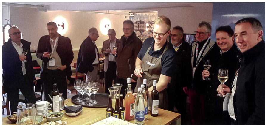
GGGS-Tagung «200 Jahre Kern Aarau» 2019.