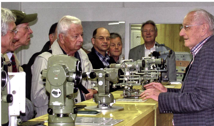
GGGS Mitgliederversammlung in Aarau 2012.