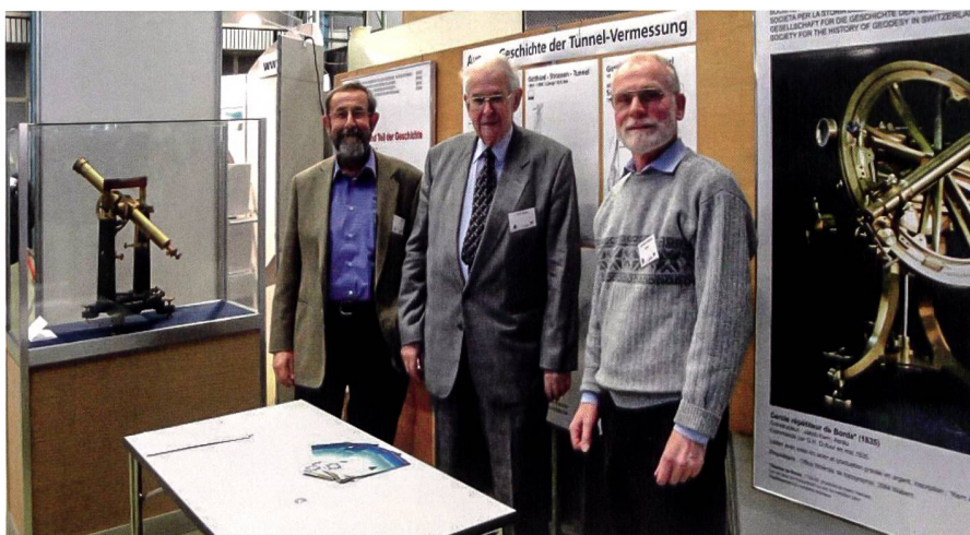
GGGS-Infostand am Anlass zum Hauptdurchschlag im Gotthardbasistunnel an der ETH Zürich 2010.