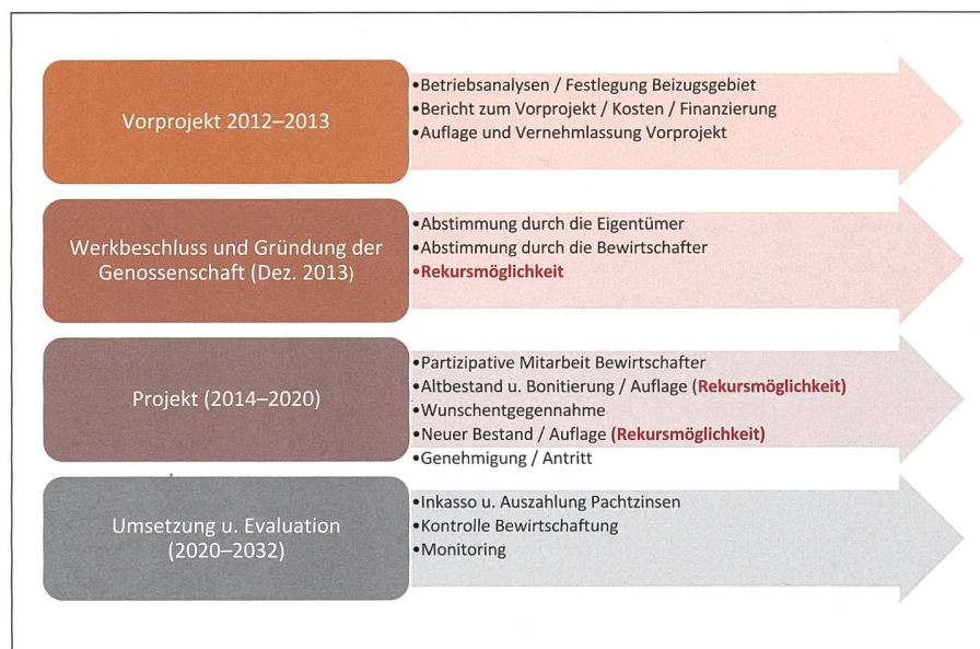
Abb. 3: Ablaufschema der Arrondierung.