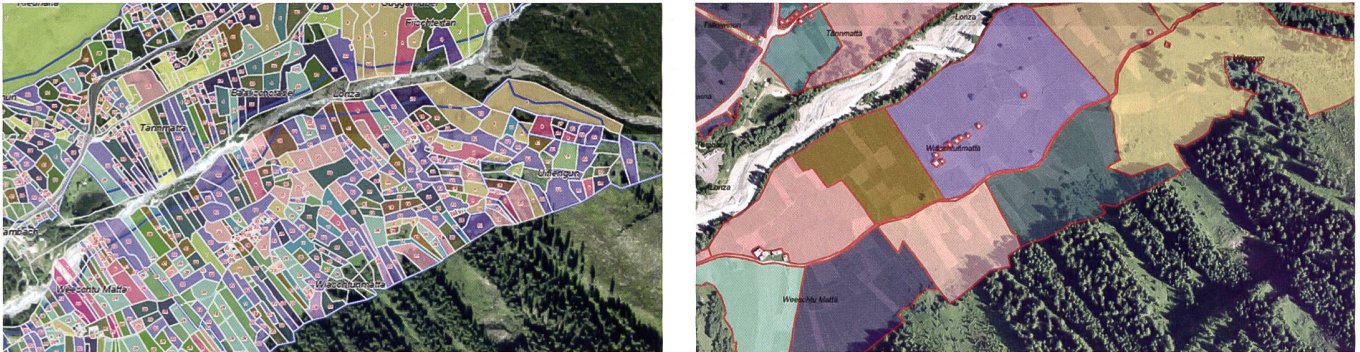
Abb. 4: Beispiel der Arrondierung im Gebiet Weestenmattu in Blatten: alter Bestand (links), neuer Bestand (rechts).

(siehe Tabelle Neubestand). Der neue Bestand wurde im September 2020 vom Staatsrat gesamthaft genehmigt und die Inbesitznahme auf den 1. November 2020 festgelegt. Der Erfolg der BA wird mittels eines zwölfjährigen Monitoringkonzepts bezüglich Landwirtschaft und Ökologie überprüft.