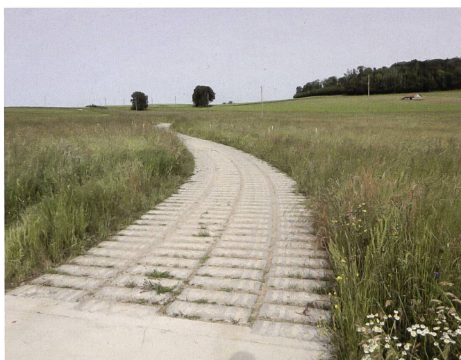
Fig. 2: Détail de la construction du chemin en plots de béton.

Au vu de la quantité d'eau retenue puis déviée par l'ancien chemin, l'aménage-