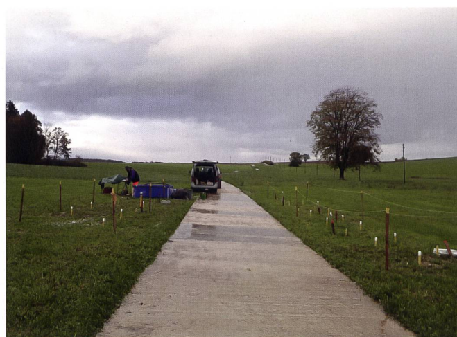
Fig. 3: Chemin en dalles de béton. Les écoulements de surface franchissant le chemin au niveau des barrages sont bien visibles.