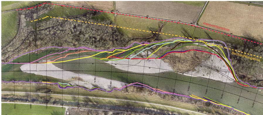
Abb. 2: Erodierte Landfläche: orange Linie = Beobachtungslinie; rote Linie = Interventionslinie.

Fig. 2: Area di terreno erosi: linea arancione = linea di osservazione; linea rossa = linea di intervento.