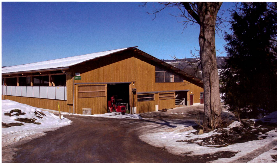
Abb. 1: Auch grossvolumige Ökonomiegebäude lassen sich gut ins Gelände einbetten. Grosse Öffnungen bringen Licht und Luft in die Gebäude (Krieger AG).

gefangen sein. Und die anderen Kinder möchten vielleicht auch noch etwas erleben. Was die Zukunft und der Markt bringen werden, weiss niemand. Betriebsumstellungen könnten notwendig werden. Dafür sind finanzielle Reserven vorzusehen. Oder die Bauernfamilie bleibt in ihrer misslichen wirtschaftlichen Lage stecken. Einem Betriebsleiterpaar stehen rund 30 Jahre aktive Zeit zur Verfügung. Vom ersten Tag an muss darum das verfügbare Geld auf das übergeordnete Zielsystem aufgeteilt werden. Alles in ein Bauprojekt zu stecken, geht nicht mehr.