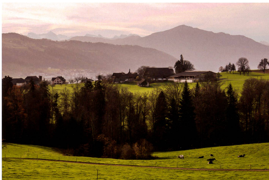
Abb. 2: Die Fassade wirkt durch die einheitliche Torgestaltung harmonisch und ruhig. Die Tore sind so konzipiert, dass alle Flächen maschinell beschickt werden können (Markus Bühler-Rasom).

Die Aspekte des Gewässerschutzes sind zu erfüllen: Auch Abstandsvorschriften gegenüber Wald, Gewässer und Schutz-zonen sowie der bauliche Tierschutz sind einzuhalten. Aus einer Aufstockung des Tierbestandes können sich Einschränkungen in der Nährstoffbilanz ergeben. Einzelne Kantone kennen auch Vorgaben zur Reduktion von Ammoniakemissionen. Zunehmend an Bedeutung gewinnen die Geruchs- und Lärmabstände. Sie sind gegenüber der Bauzone und gegenüber nicht-landwirtschaftlichen Wohnnutzungen in der Landwirtschaftszone einzuhalten. Sind sie nicht eingehalten, muss im Falle einer Klage die landwirtschaftliche