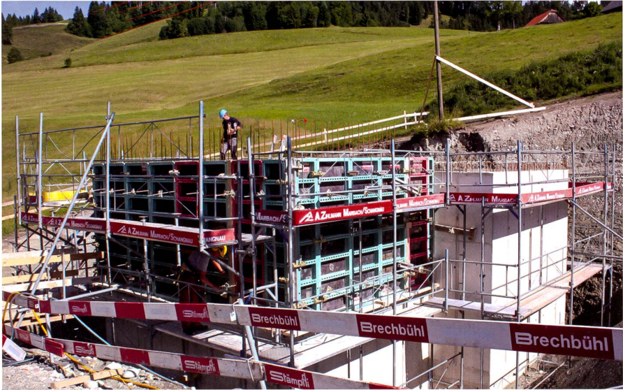
Abb. 1: Neubau Reservoir Längschwand.

Mittel 180 Liter Wasser liefern. Die ausgewählten Quellen liegen auf einer Höhe von 945 m und 1010 m. Ein Grossteil des künftigen Versorgungsgebietes liegt demzufolge höher als die Wasserbezugsorte. Das Wasser der Quelle von Michlischwand muss (bei Maximalverbrauch) in das höher gelegene Reservoir Längschwand (exkl. Löschwasserreserve) und von dort in das Reservoir Chnubelsegg (inkl. Löschwasserreserve) gepumpt werden. Das Wasser ab