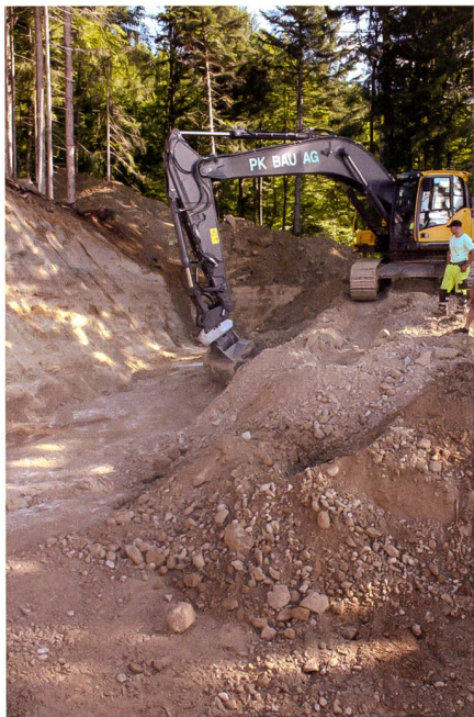
Abb. 2: Vorbereitungsarbeiten für Standort Reservoir Chnubelsegg.

Das Fassungsvermögen der Reservoirs beträgt für Längschwand 130 m 3 (Tagesverbrauch Niederzone, Puffer für Nachtförderung Hochzone) und für Chnubelsegg 150 m 3 (Tagesverbrauch Hochzone, Löschreserve gesamt). Bei beiden Reservoirs ist zudem ein Puffervolumen für einen Störfall enthalten (50% Tagesverbrauch). Das Reservoir Längschwand dient zudem als Pumpstation und Druckbrecheranlage. Bei den Pumpstationen wurden je zwei Pumpen installiert, die alternierend fördern und dadurch die Betriebssicherheit wesentlich erhöhen. So können Schäden beheben oder Revisionen an den Pumpen durchgeführt werden, ohne dass die Wasserversorgung unterbrochen werden muss. Die Gesamtlänge der Pumpendruckleitungen misst 3000 m, die der Hauptleitungen 9000 m. Alle Hauptleitungen wurden als geschweisste HD-PE-Rohre verlegt, alle Pumpendruckleitungen und Verteilungen mit PE-Druckschläuchen erstellt. Das neue Verteilungsnetz führt durch teilweise sehr steiles Wies- und Weideland, vereinzelt auch durch Wald. Auf der ganzen Leitungslänge war der Untergrund felsdurchsetzt. An diversen Stellen waren