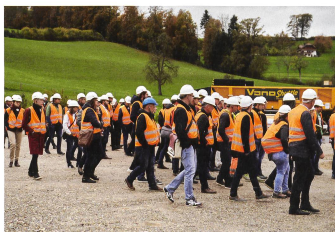
Die meisten der 500 Besucher der Swiss Dimensions 2019 nutzen nicht nur das Angebot der Fachvorträge und Informationsstände, sondern besuchten auch eine der geführten Touren im Aussenbereich.