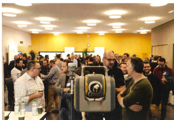
Zwischen den Fachvorträgen: Zeit für einen Informationsaustausch über innovative Vermessungslösungen wie die Trimble SX10.