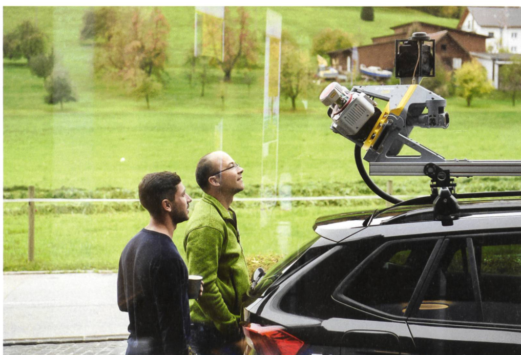
Premiere auf der Swiss Dimensions 2019: High-End Mobile Mapping System Trimble MX9.

allnav ag Ahornweg 5a CH-5504 Othmarsingen Telefon 043 255 20 20 allnav@allnav.com www.allnav.com