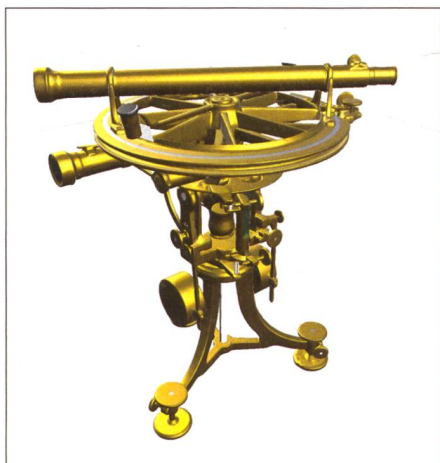
Abb. 2: Der texturierte digitale Zwilling des Borda-Kreises (Berchtold & Pünter, 2018).

Laien doch eher schwierig. Deshalb war die Idee, den digitalen Borda-Kreis-Zwilling in einer App auf dem eigenen Smartphone oder auf einem Tablet so zu präsentieren, dass möglichst auch eine Messung simuliert werden kann.