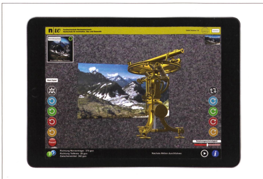
Abb. 4: Die Tablet-App zeigt den Borda-Kreis vor einem Panorama-Image Target. Mit den verschiedenen Knöpfen können die verschiedenen Komponenten des Borda-Kreises einzeln rotiert werden (Berchtold & Pünter, 2018).