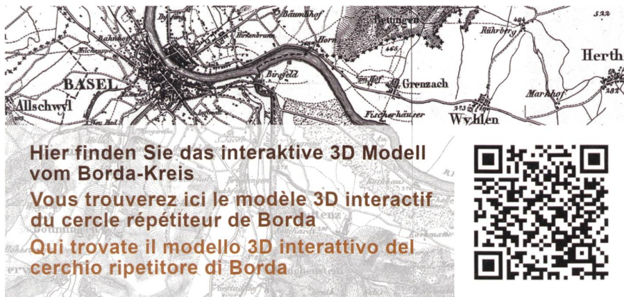
Abb. 5: QR-Tag scannen, um die App zu installieren.

phones und Tablets sind performant genug, um mit einer entsprechenden App künstliche Objekte im Livestream der Kamera darzustellen. Somit sieht man auf dem Display live die von der Kamera aufgenommene Realität, welche beliebig erweitert, also augmentiert, werden kann. In der Bachelorarbeit entstand ein komplett modellierter digitaler Zwilling des Borda-Kreises sowie eine Smartphone- und eine Tablet AR-Applikation für iOS- sowie Android-Geräte. Das erstellte Modell des Borda-Kreises kann für zukünftige Anwendungen oder weiterführende Arbeiten verwendet werden. Für