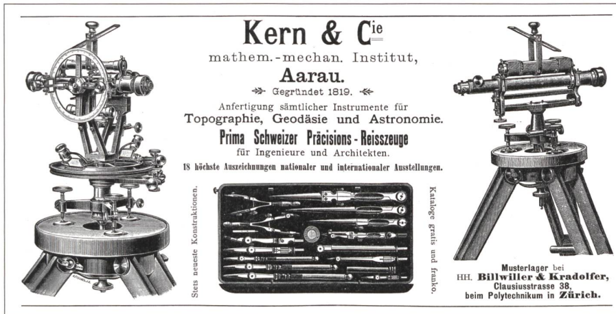
Abb. 1: Eines der ältesten Inserate aus der Schweizerischen Bauzeitung von 1899.