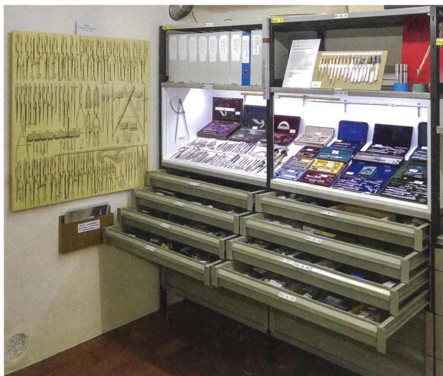
Abb. 4: Ein Blick in die Studiensammlung Kern: Einzelinstrumente und Sets aus der Reisszeug-Produktion.

Die Studiensammlung wird von der «Arbeitsgruppe Kern» aus ehemaligen Mitarbeitenden von Kern, Mitarbeitenden des Stadtmuseums und weiteren Fachleuten erschlossen und unterhalten. Sie konnte in den letzten 30 Jahren durch Schenkungen und Leihgaben erweitert werden. Die Sammlung ist bedeutend, umfasst sie doch nicht nur eine repräsen-