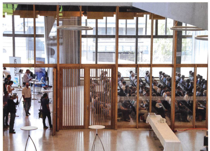
Abb. 2: 3DGI 2019 profitiert von der topmodernen Tagungsinfrastruktur für Fachprogramm und Ausstellung.