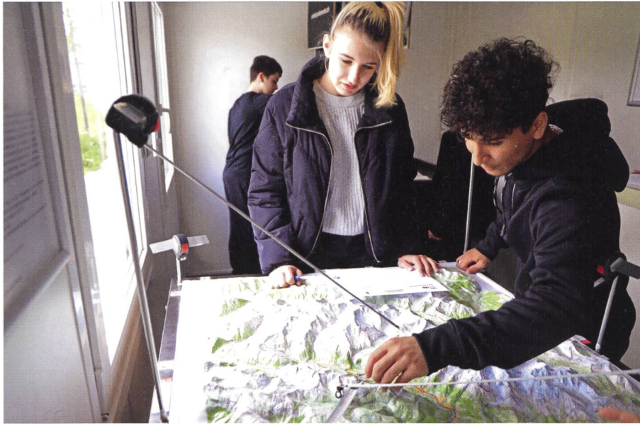
Abb. 3: Wie funktioniert die Ortsbestimmung mit GPS? Teilnehmende am SwissGeoLab mit dem Experiment zur Ortsbestimmung.

Baselland interaktiv auf einer Karte abbildet, sowie «LiveMap Switzerland», bei dem mit einem Tablet eine Karte zum Leben erweckt und mit Informationen in Echtzeit angereichert werden kann.