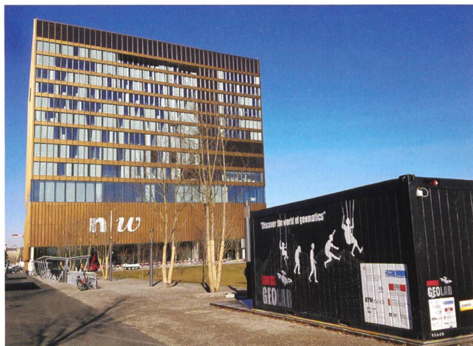
Abb. 1: Der SwissGeoLab Container im Park des neuen Campus Muttenz der FHNW.

Seminarraum im 10. OG geführt. Auf dem Weg dorthin gab es bereits diverse Fragen zu beantworten. Das Interesse der Schülerinnen und Schüler am Gebäude war gross, zumal die Treppen der ersten drei Stockwerke und