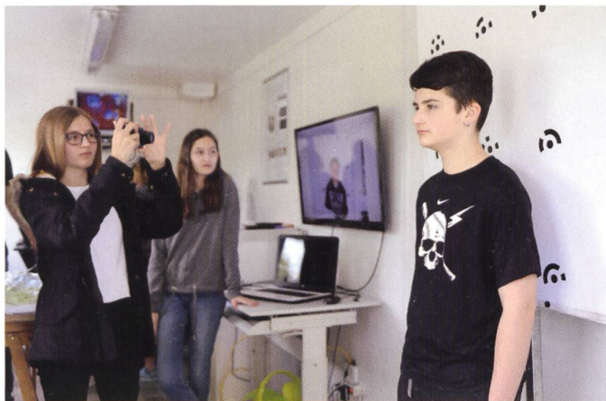
Abb. 4: Erstellen eines 3D-Porträts mit mehreren Bildern aus verschiedenen Betrachtungswinkeln.