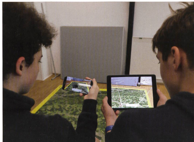
Abb. 2: Die Schulklassen beschäftigen sich mit der am Institut Geomatik entwickelten Augmented Reality App.