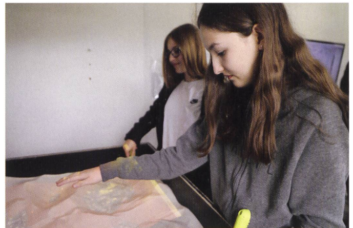
Abb. 5: Mit dem «AR Sandkasten» entdeckten die Teilnehmenden in spielerischer Form Grundlagen der Topographie.