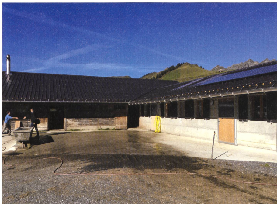
Fig. 3: PDR Val d'Illiez.

extensions du point de vente collectif de produits du terroir «La Cavagne» déjà existant et situé à Troistorrents. Ces deux mesures permettront de valoriser les