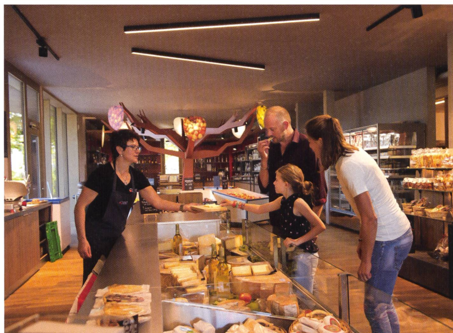
Fig. 2: PDR Marguerite.

De 2016 à 2022, le projet de développement régional «Marguerite» a pour vocation de favoriser la coopération entre les secteurs de l'agriculture, de l'artisanat et du tourisme dans le canton du Jura ainsi que dans le Jura bernois. Ce PDR vise à donner un nouvel essor à l'agritourisme et à dynamiser la production et la vente de produits régionaux. Il est prévu, en particulier, de tirer parti du symbole cultu-