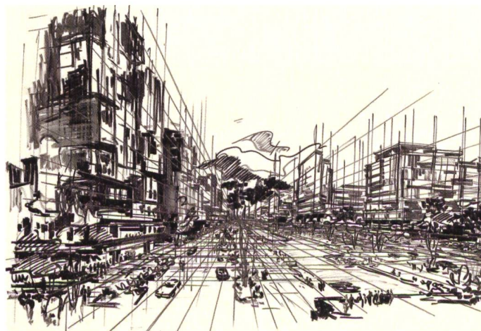
Abb. 2: 1968 entwirft Otto Glaus seine Vision eines urbanisierten Sihlraums, was zum Abbruch ganzer Wohnquartiere geführt hätte.