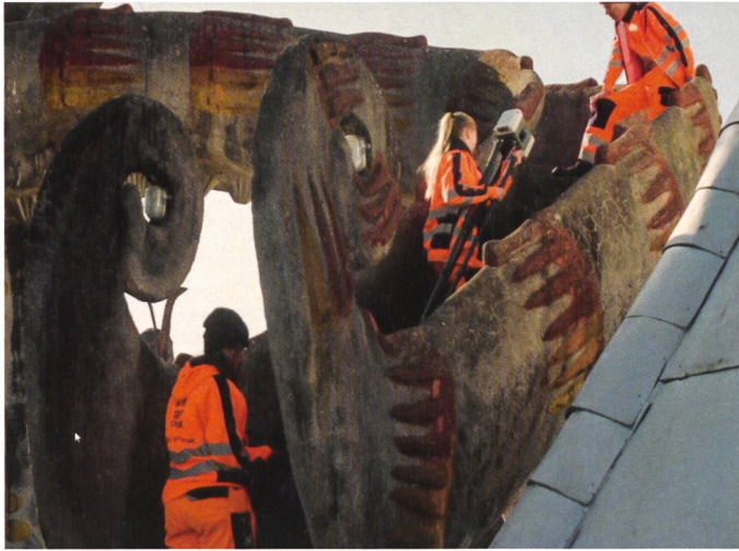
Abb. 3: Messung Doppel-Flügelhund.