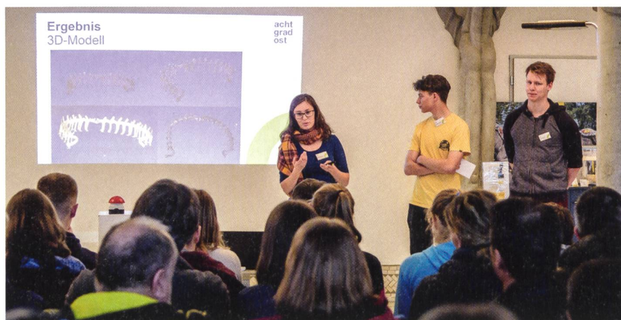
Abb. 2: Präsentation Gruppe 3D-Objekterfassung.

Acht Grad Ost AG ist seit vielen Jahrzehnten erfolgreich mit ihren Ingenieur- und Geometer-Dienstleistungen tätig. Als Nachführungsstelle der amtlichen Vermessung ist sie zuständig für die Sicherung des Grundeigentums in 36 Gemeinden der Kantone Uri und Zürich und besitzt weitreichende Kompetenzen im Erfassen, Strukturieren, Verwalten und Analysieren von raumbezogenen Daten (Geodaten). Ein wichtiges Anliegen ist der Berufsnachwuchs. Während der vier Jahre dauernden Ausbildung zur Geomatikerin oder zum Geomatiker geben die Ausbilder den Jugendli-