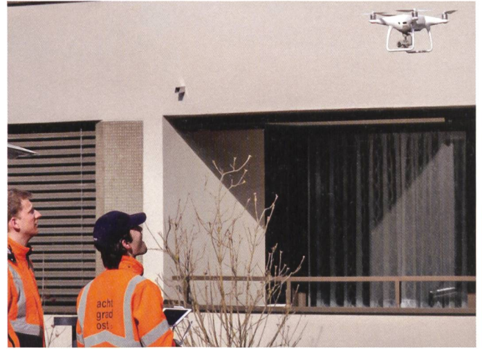
Abb. 4: Start Drohnenbildflug.

Punkte als umso zeitaufwändiger», zieht Michelle Meile, die kurz vor dem Lehrabschluss steht, ein Fazit.