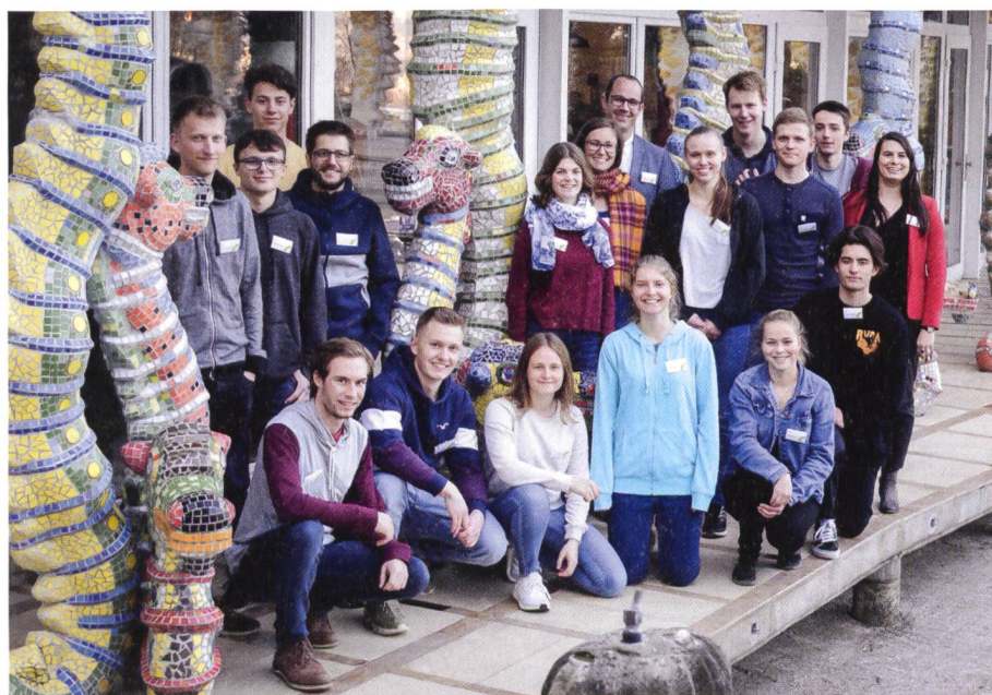
Abb. 1: Gruppenbild Lernende Acht Grad Ost mit Betreuerinnen und Betreuern.

An der Schlussveranstaltung im Bruno Weber Park präsentierte auch die Gruppe «3D-Objekterfassung» ihre Arbeit einem breiteren Publikum wie Eltern, Mitarbeitenden sowie weiteren Interessierten. Diese Gruppe erfasste mit dem neuesten Modell eines Laserscanners den Doppel-Flügelhund – eine der grössten Skulpturen im Bruno Weber Park. Aus der gemessenen Punktwolke wertete sie ein 3D-Modell dieser 110 m langen Betonskulptur aus. «Dieses komplexe Objekt konnten wir im Feld relativ zügig vermessen. Dafür erwies sich die Auswertung der über eine Milliarde