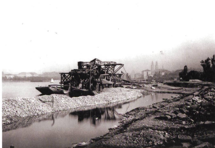
Abb. 1: Zwischen 1882 und 1887 lässt Arnold Bürkli im Zürcher Seebecken Land aufschütten für öffentliche Parkanlagen.

Die ausgestellten Pläne, Skizzen, Broschüren, Modelle, Fotos, Abstimmungsplakate sowie Inventarblätter von Gebäuden der Stadt Zürich, die wie ein Band die Ausstellung durchziehen, eröffnen vielfältige Zugänge zum Thema «Anarchiv» nennen die Kuratoren das Ausstellungsformat. Damit bezeichnen sie ein Archiv, das sich zu einer neuen Ordnung zusammenbringen lässt. Eindrücklich sind die Konvolute unter dem Titel «Die gescheiterte Moderne». Nach dem Zweiten Weltkrieg ging es nicht mehr um den Entwurf einer neuen Stadt, sondern um die Steuerung des Urbanisierungsprozesses durch Verkehrsprojekte. Solche wurden zum strategischen Instrument, die Stadt mit der Region zu verknüpfen. Die Basis bildete der «Generalverkehrsplan». Legendär sind Projekte wie das Expressstrassen-Ypsilon, die U-Bahn oder der City-Ring. Die-