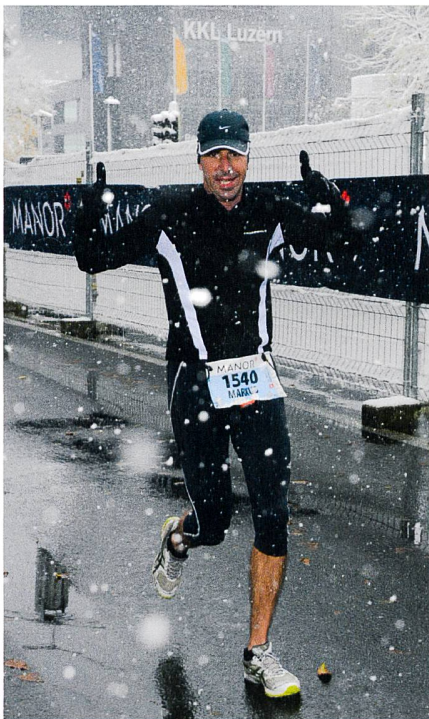
Abb. 1: Lucerne Marathon 2012 bei Schneefall.

Eine gesunde Balance zwischen Beruf und Privatleben ist wichtig, ist aber nicht immer einfach zu bewerkstelligen. Der Sport ist ein wichtiger Ausgleich zum Arbeitsalltag und erlaubt mir, den Kopf zu lüften und abzuschalten. Während meinem Ausdauersport habe ich auch Zeit, meine Gedanken zu ordnen und nicht selten entstehen beim Sich-Bewegen in der Natur Lösungen für berufliche Probleme. Interessant ist auch zu beobachten, wie insbesondere im letzten Jahrzehnt Geo(informatik)-Themen auch im Sport- und Freizeitbereich