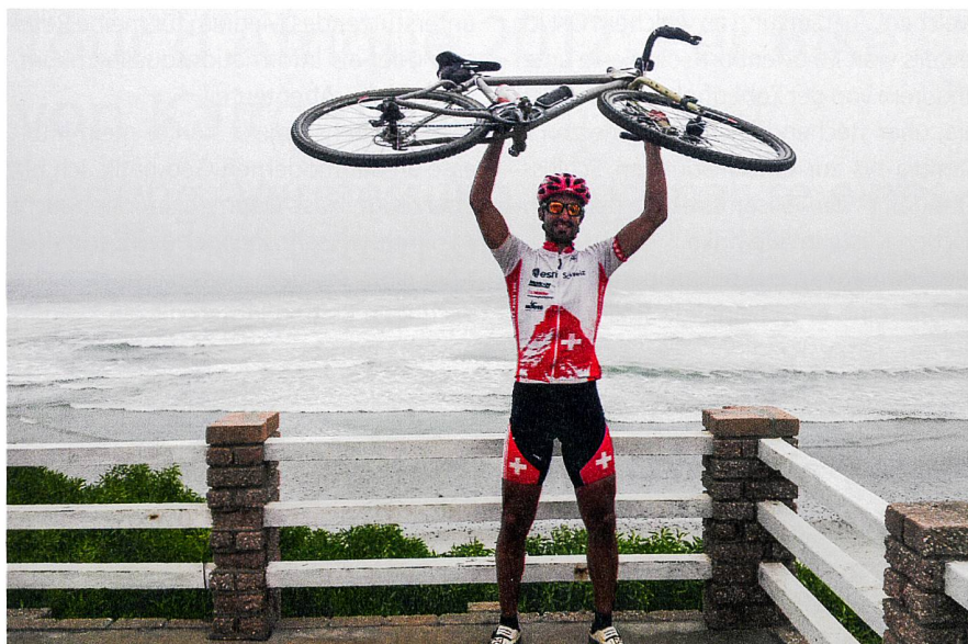
Fig. 2: Geste des vainqueurs «Tour d'Afrique» devant la coulisse de l'atlantique à Strandfontein (Afrique du Sud), à l'annonce de la victoire du tour à la 91 e étape (sur 94).

Abb. 2: TdA-Geste vor Küste des Atlantiks in Strandfontein (Südafrika) bei Bekanntgabe des Toursiegs auf Etappe 91 von 94.