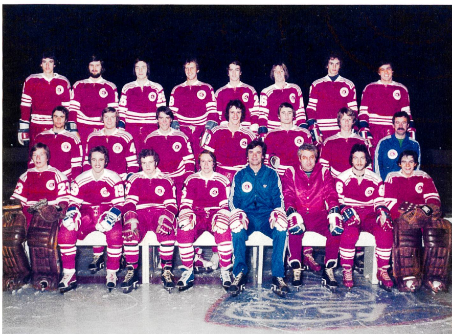
Abb. 1: Mannschaftsfoto A-Junioren Weltmeisterschaft, 1978 (vorderste Reihe rechts).

Ich konnte gleichzeitig ein Studium absolvieren und Spitzensport betreiben. Dies erforderte allerdings eine konsequente Organisation und das Entgegenkommen der Professoren und des Sportvereins, etwa dann, wenn an einem Spieltag wichtige Übungen in der ETH Zürich anstanden. So erhielt ich die Möglichkeit, aufgrund von Spielen verpasste Übungen nachzuholen, um letztlich die notwendigen Testate zu erhalten. Dankbar bin ich auch für den guten Zusammenhalt unter den Studenten, die mir beispielsweise ihre Vorlesungsnotizen überliessen, wenn ich sportbedingt abwesend war. Nach dem