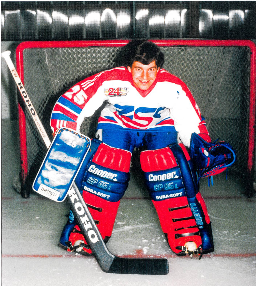
Fig. 4: Photo portrait de la saison 1987/88. Abb. 4: Porträtfoto aus der Saison 1987/88.

efficacité, de manière concentrée et en mettant les priorités pour surmonter les phases stressantes et pour me rendre disponible en faveur de mes activités sportives. Aujourd'hui encore, je profite de ces qualités.