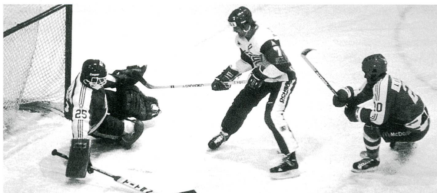
Abb. 3: Zürcher-Derby ZSC gegen den EHC Kloten, 1984.

den Sport, sonst noch schlägt. Dabei muss man nicht zwingend dem beruflichen Modetrend folgen, sondern sich nach einem Berufsfeld umsehen, das viele Entwicklungs- und Weiterbildungsmöglichkeiten erlaubt. Gerade in der Kulturtechnik warten landwirtschaftliche Infrastrukturanlagen mit einem immensen Wiederbeschaffungswert darauf, durch motivierte Nachwuchskräfte fachgerecht unterhalten und innovativ weiterentwickelt zu werden.