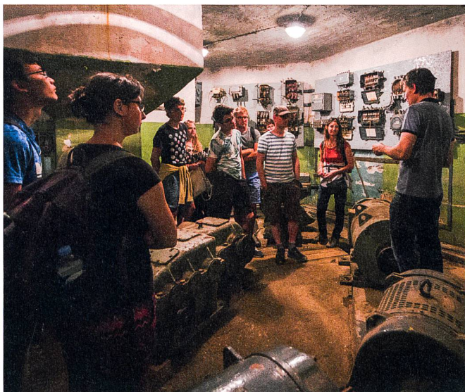
Abb. 3: Besuch Kontrollzentrum Irbene.