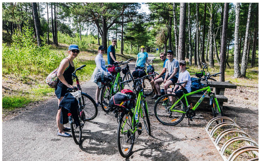
Abb. 2: Velotour Kurische Nehrung.

In Gruppen erkunden wir mit dem Velo die Kurische Nehrung – eine 100 km lange Sand-Sichel, die bis nach Russland reicht. In Erinnerung bleiben: Dünen, (Gegen-)Wind, Velowege, Sandstrand ohne Ende, Kormorane, Fachwerkhäuser, blaues Meer, Bernstein, Fussgängerfähren, Sandburgen und ganz viel Sonnenschein!