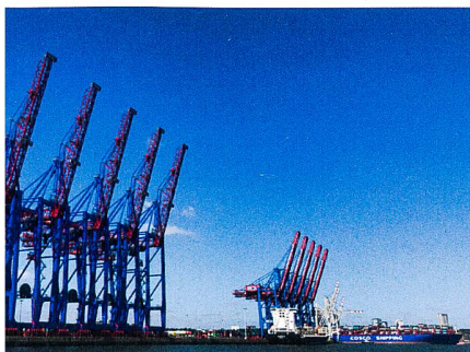
Abb. 1: Hafenrundfahrt Hamburg.

Nach einer kurzen und ruckligen Nacht im Zug werden wir schon frühmorgens vom Zugchef mit dem Frühstück geweckt. Nach der Ankunft in Hamburg geht es sofort ins Miniaturwunderland, wo wir schon eine kleine Weltreise unternehmen durch Deutschland, Skandinavien, Italien, Österreich, Amerika, Knuffigen und natürlich die Schweiz! Zu sehen gibt es dort vieles: Züge, Häuser, fliegende Flugzeuge, unzählige Feuerwehren, Ufos, Raketenstarts, Vulkanausbrüche und sogar ein DJ-Bobo-Konzert