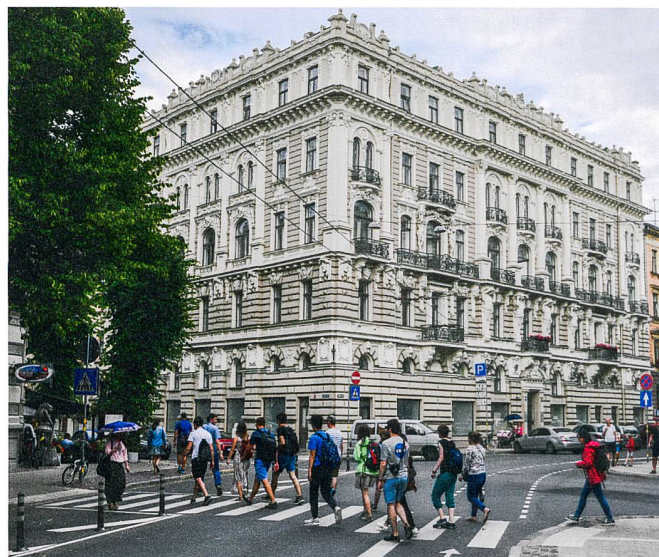
Abb. 4: Stadtrundgang Rīga.