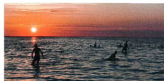
Abb. 5: Nachtbad Insel Hiiumaa.

Von 9 Uhr morgens bis 9 Uhr abends sind heute drei Busfahrten, eine Fähre und eine Autofahrt geplant, um von Rīga auf die estnische Insel Hiiumaa zu gelangen. Ein dreistündiger Zwischenstopp in Pärnu wird fürs Mittagessen und einen Stadtspaziergang genutzt. Nach kurzer Ungewissheit, ob wir einen Bus finden, der uns alle von Tallinn bis zur Insel bringt, haben wir es schliesslich aufgeteilt in zwei Busse geschafft (besten Dank an die nur estnisch und russisch sprechenden Buschauffeure!) und können auf der Fähre die Sonnenstrahlen geniessen. Am Hafen Heltermaa auf Hiiumaa holen uns die Inhaber unserer Ferienhäuser ab und fahren uns mit dem Auto zu den hübschen Holzhäuschen in der wilden estnischen Natur. Da der Strand nur wenige hundert Meter entfernt ist und es noch herrlich warm ist, können wir den Sonnenuntergang um halb elf im Meer schwimmend beobachten.