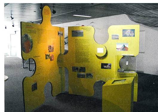
Ausstellung im Verkehrshaus 2005.