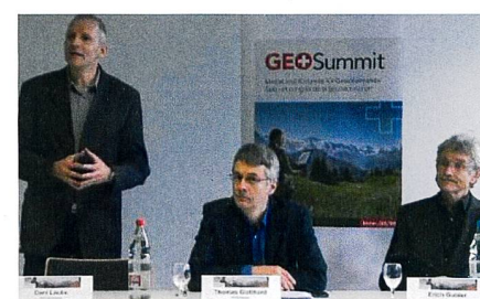
OK GIS/SIT und GEOSummit.