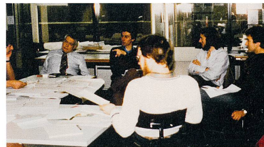
Lehrveranstaltungen an der Abt. VIII und D-BAUG.

In dieser Zeit entstand auch das Internet. Sowohl die PR-Gruppe als auch die VPK erhielten ihre Website, die ich betreute. Mit der Begriffsanpassung von Vermessung zu Geo-