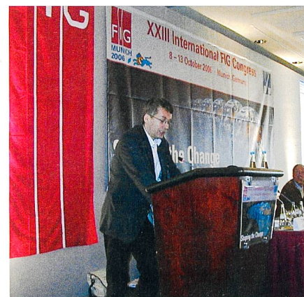
20 Jahre FIG-Vertretung.